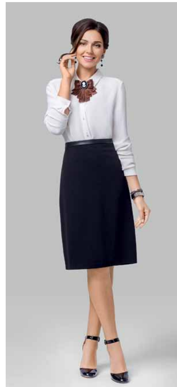
ЮБКА арт. LA-718030

ЦВЕТ: Черный | Темно-синий | Серый меланж