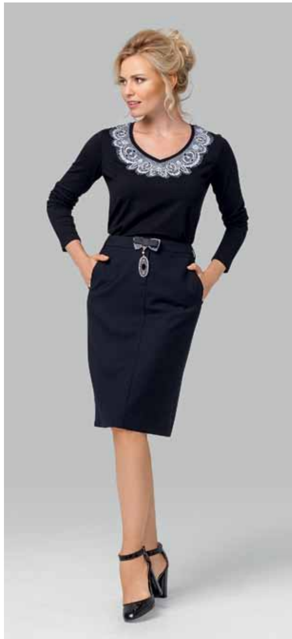
ДЖЕМПЕР арт. LA-713099

РАЗМЕР: 42-56 МАТЕРИАЛ: 95% вискоза | 5% эластан ЦВЕТ: Молочный | Черный