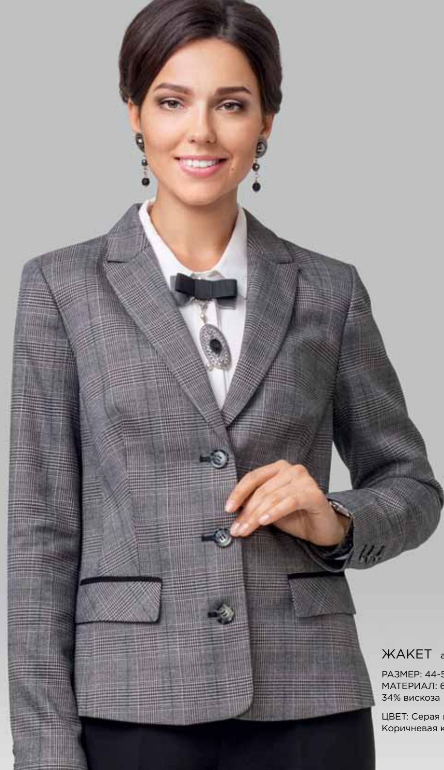
ЖАКЕТ арт. LA-05518