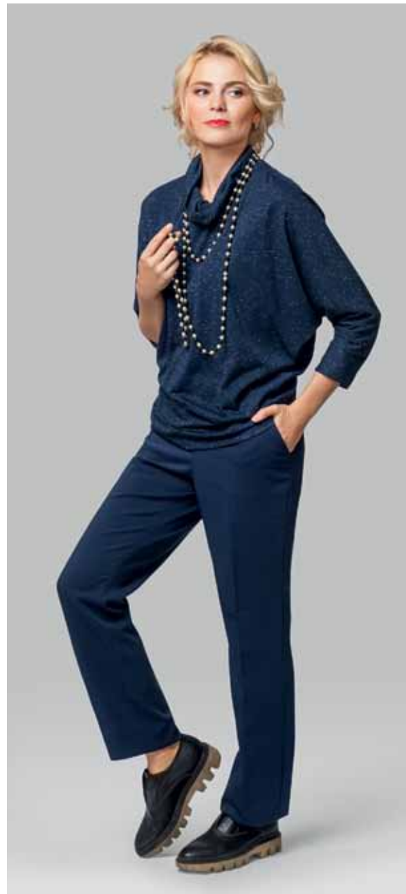
ДЖЕМПЕР арт. LA-713123