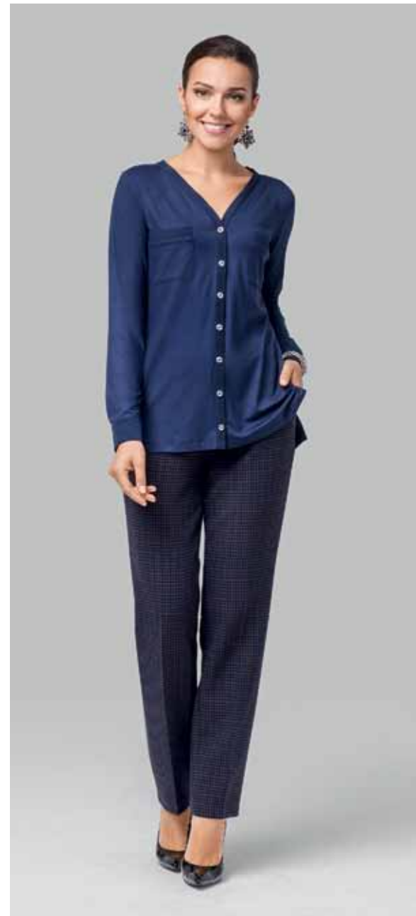
БЛУЗКА арт. LA-711098