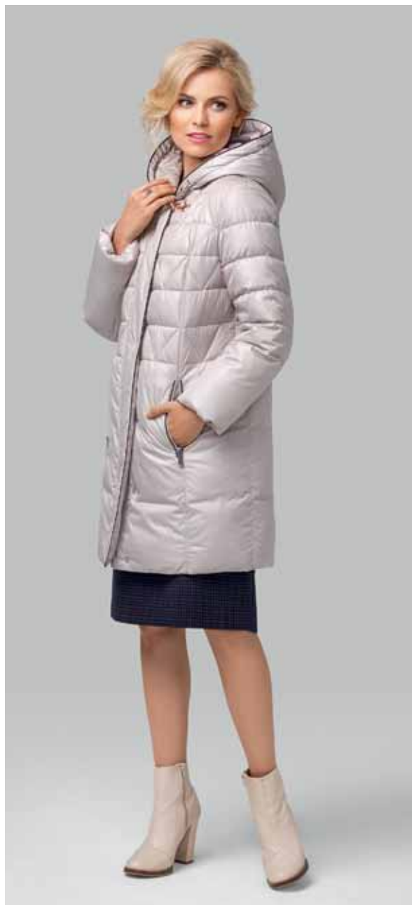
ПОЛУПАЛЬТО арт. LA-F03279

ЦВЕТ: принт "Акварельные цветы" - песочный