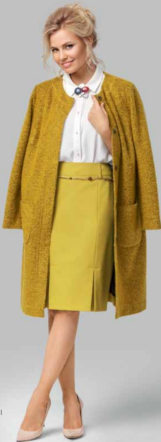
ПАЛЬТО арт. LA-705077