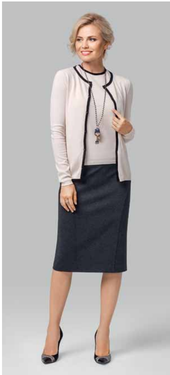
КАРДИГАН арт. LA-723115

РАЗМЕР: М - XXL МАТЕРИАЛ: 96% вискоза | 4% эластан