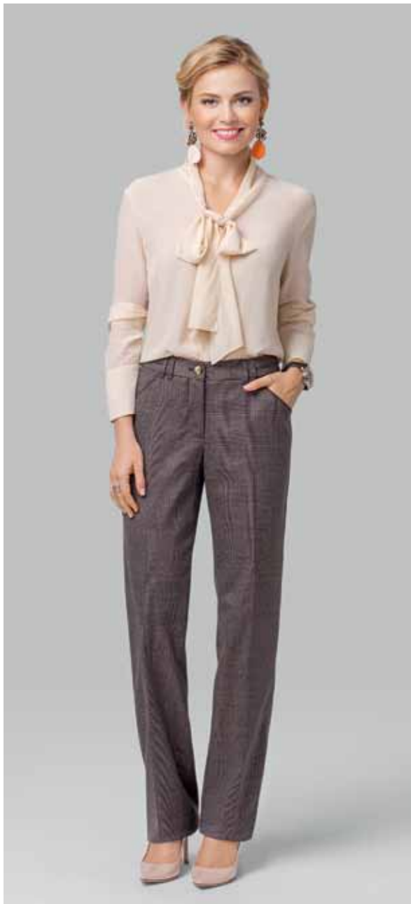
БРЮКИ арт. LA-19519

РАЗМЕР: 44-56 МАТЕРИАЛ: 63% полиэстер | 34% вискоза | 3% эластан