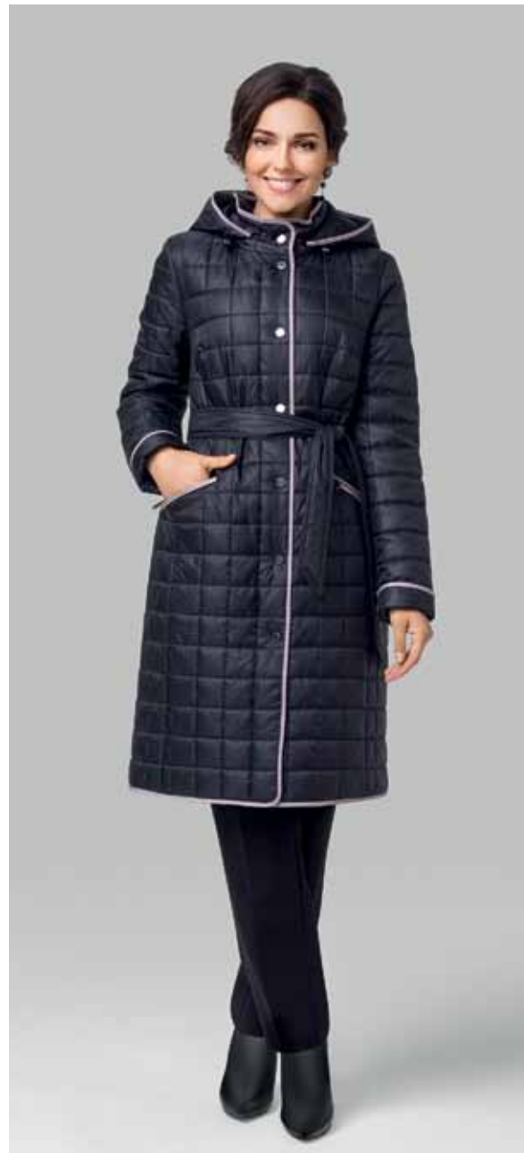
ПАЛЬТО арт. LA-P01270

РАЗМЕР: 44-56 | ДЛИНА: 96 см МАТЕРИАЛ: 100% полиэстер УТЕПЛИТЕЛЬ: натуральный пух ЦВЕТ: принт "Розы" - черный | принт "Розы" - дымчато-коричневый