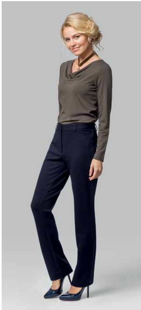
ДЖЕМПЕР арт. LA-713097 РАЗМЕР: 42-54 МАТЕРИАЛ: 95% вискоза | 5% эластан