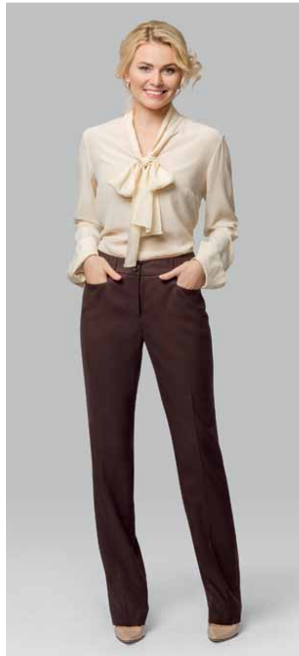
БРЮКИ арт. LA-19682

ЦВЕТ: Молочный | Темно-синий | принт "Кукуруза"