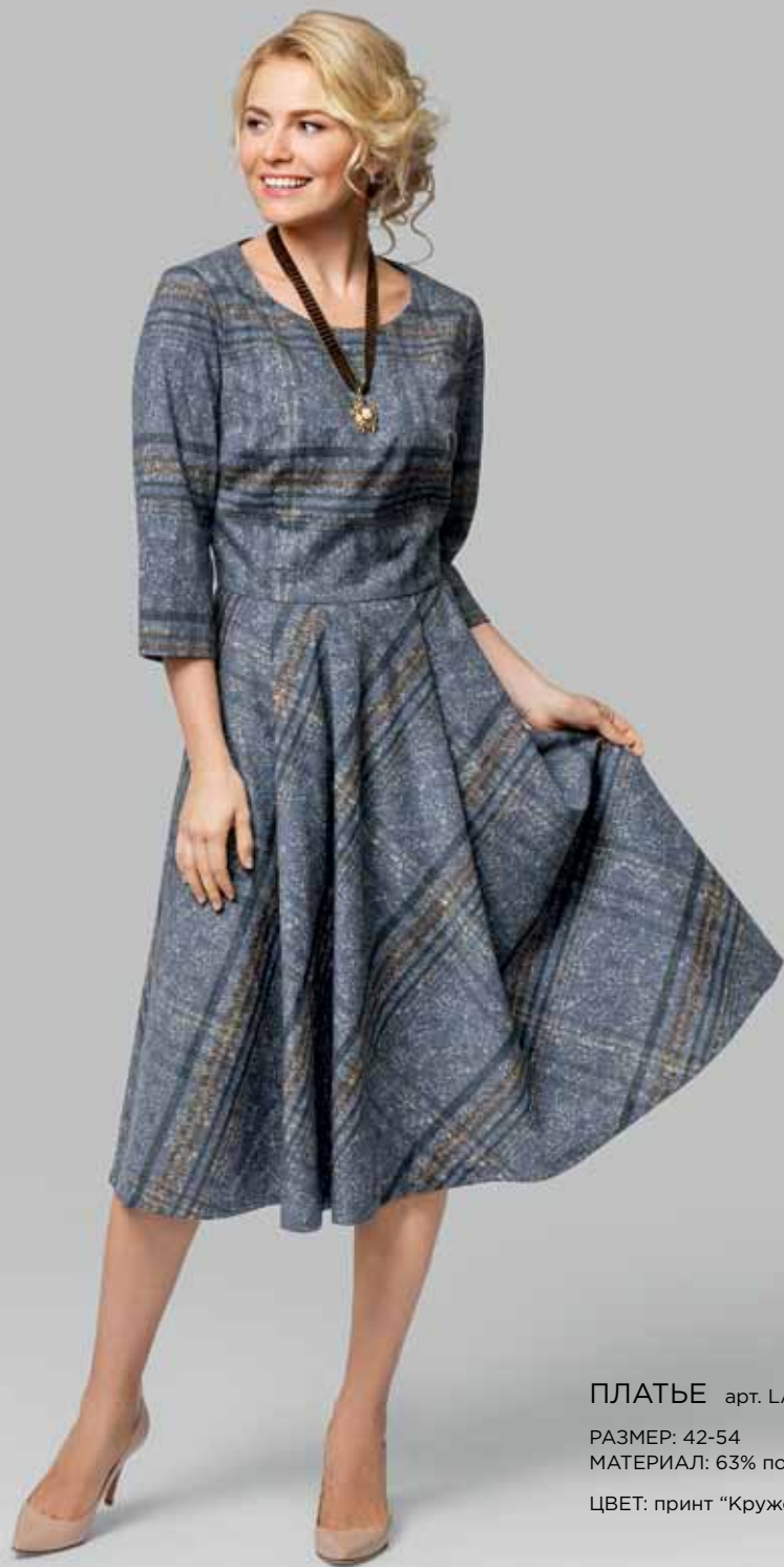
ПЛАТЬЕ арт. LA-716087