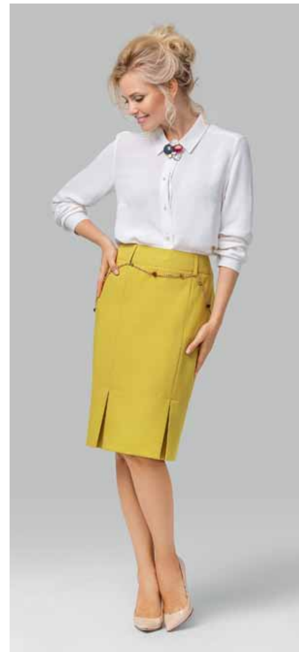
ЮБКА арт. LA-718111

ЦВЕТ: Черный | Красный | Серый меланж | Темно-синий