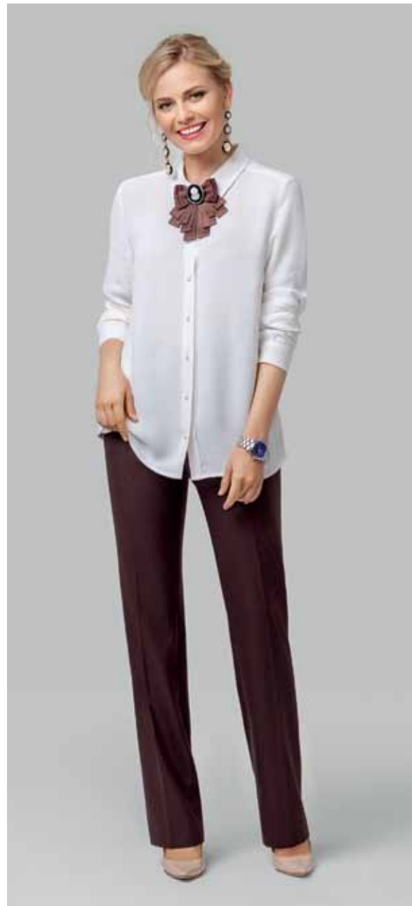
БЛУЗКА арт. LA-711042