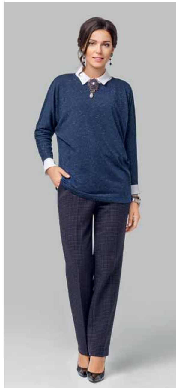
ДЖЕМПЕР арт. LA-713095