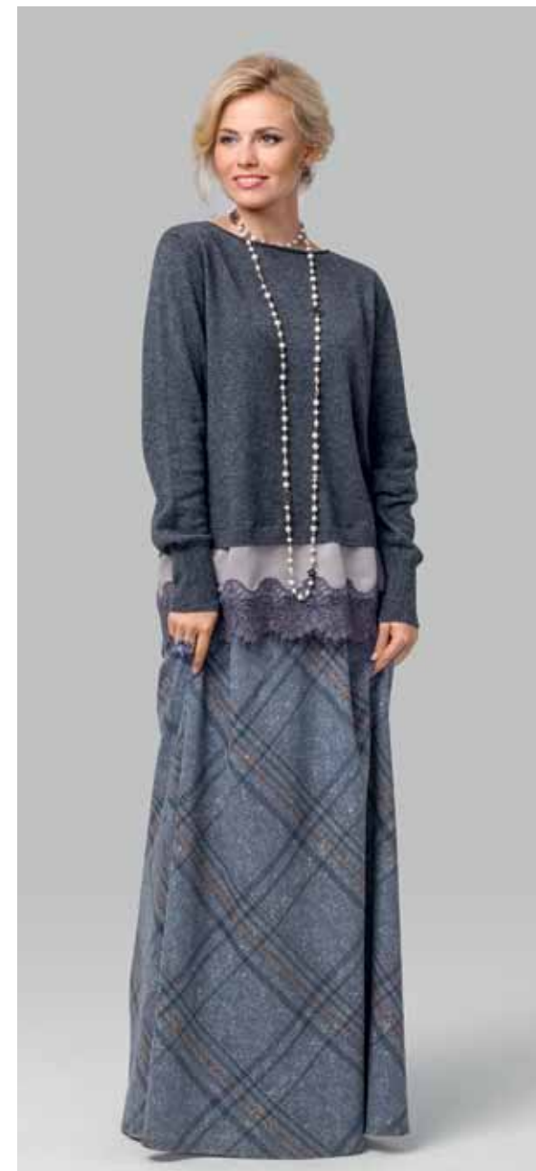
ДЖЕМПЕР арт. LA-708083

ЦВЕТ: Черный | Красный | Серый меланж | Темно-синий