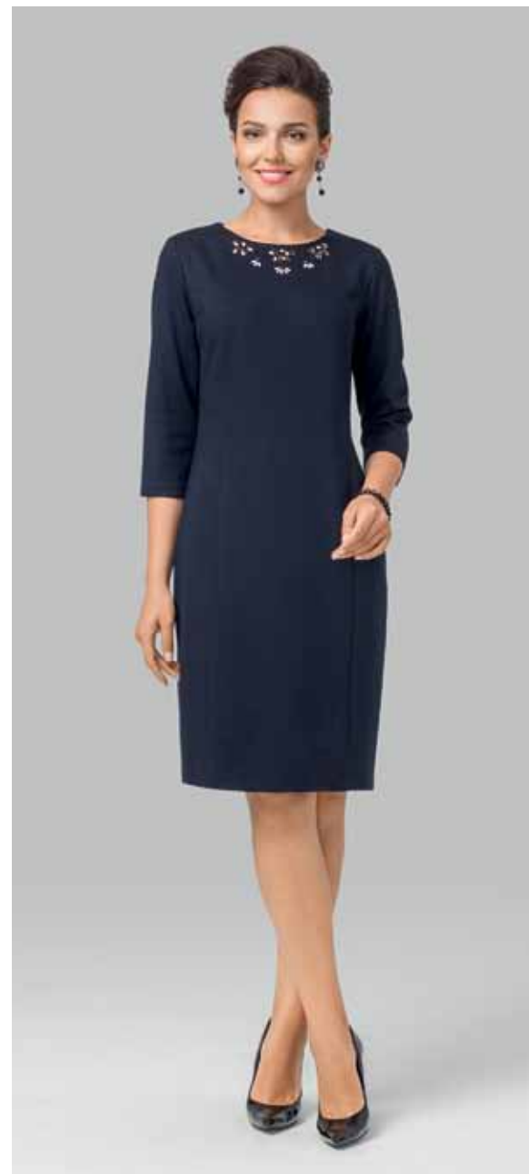
ПЛАТЬЕ арт. LA-716060

ЦВЕТ: Молочный | Темно-синий | Принт "Кукуруза"