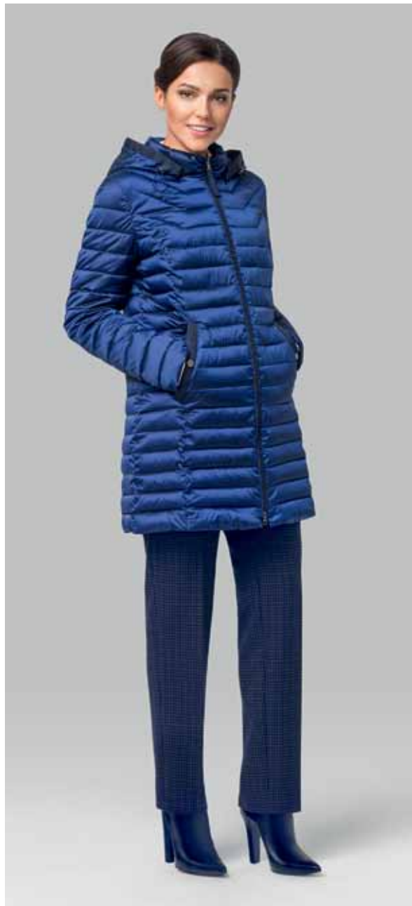
КУРТКА арт. LA-F01261

РАЗМЕР: 42-56 | ДЛИНА: 80 см МАТЕРИАЛ: 100% Нейлон