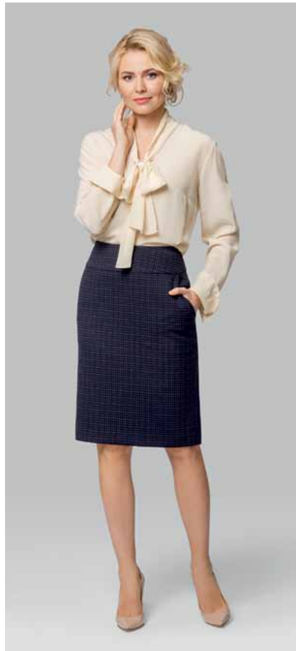
ЮБКА арт. LA-718119