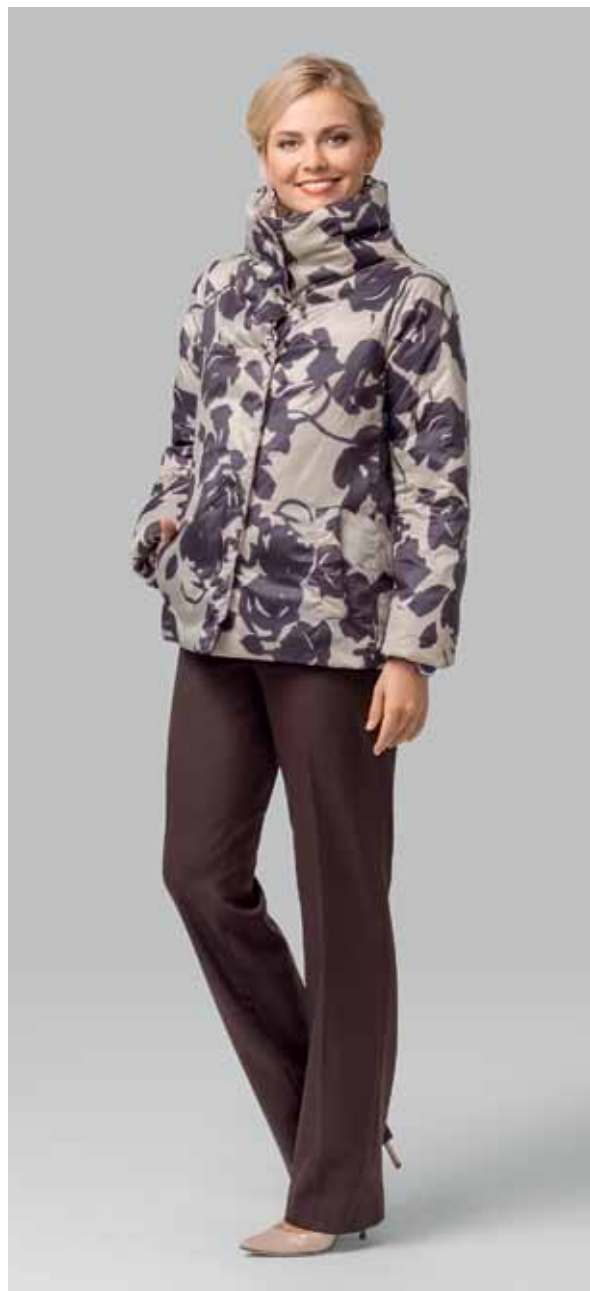
КУРТКА ДВУХСТОРОННЯЯ арт. LA-D03277

РАЗМЕР: 42-56 | ДЛИНА: 66 см МАТЕРИАЛ: 100% полиэстер УТЕПЛИТЕЛЬ: натуральный пух