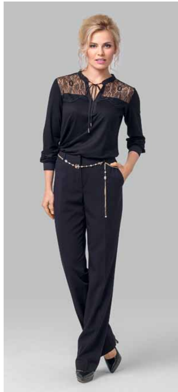
БРЮКИ арт. LA-19991