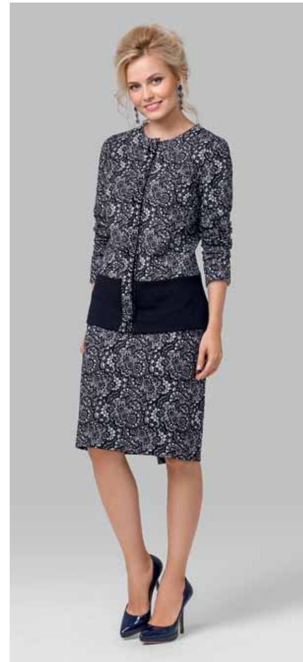
ЖАКЕТ арт. LA-705026

РАЗМЕР: 42-56 МАТЕРИАЛ: 60% вискоза | 30% полиамид | 10% лайкра ЦВЕТ: Синий | Черный | Кружевной жаккард черный | Кружевной жаккард синий