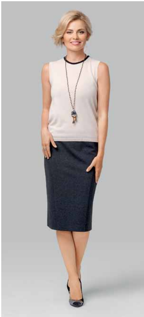
ДЖЕМПЕР арт. LA-723113

РАЗМЕР: М - XXL МАТЕРИАЛ: 96% вискоза | 4% эластан