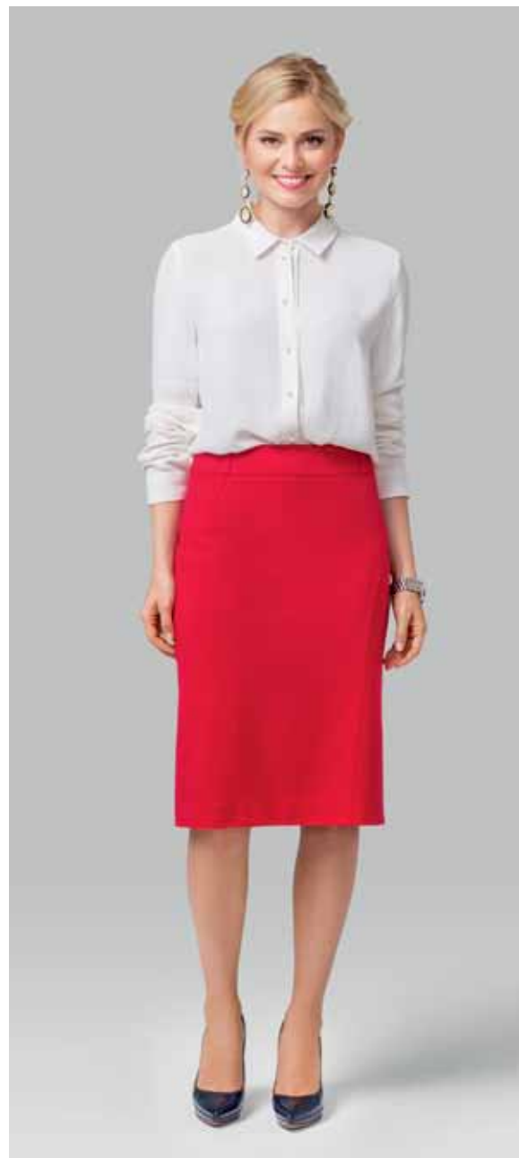
ЮБКА арт. LA-718117