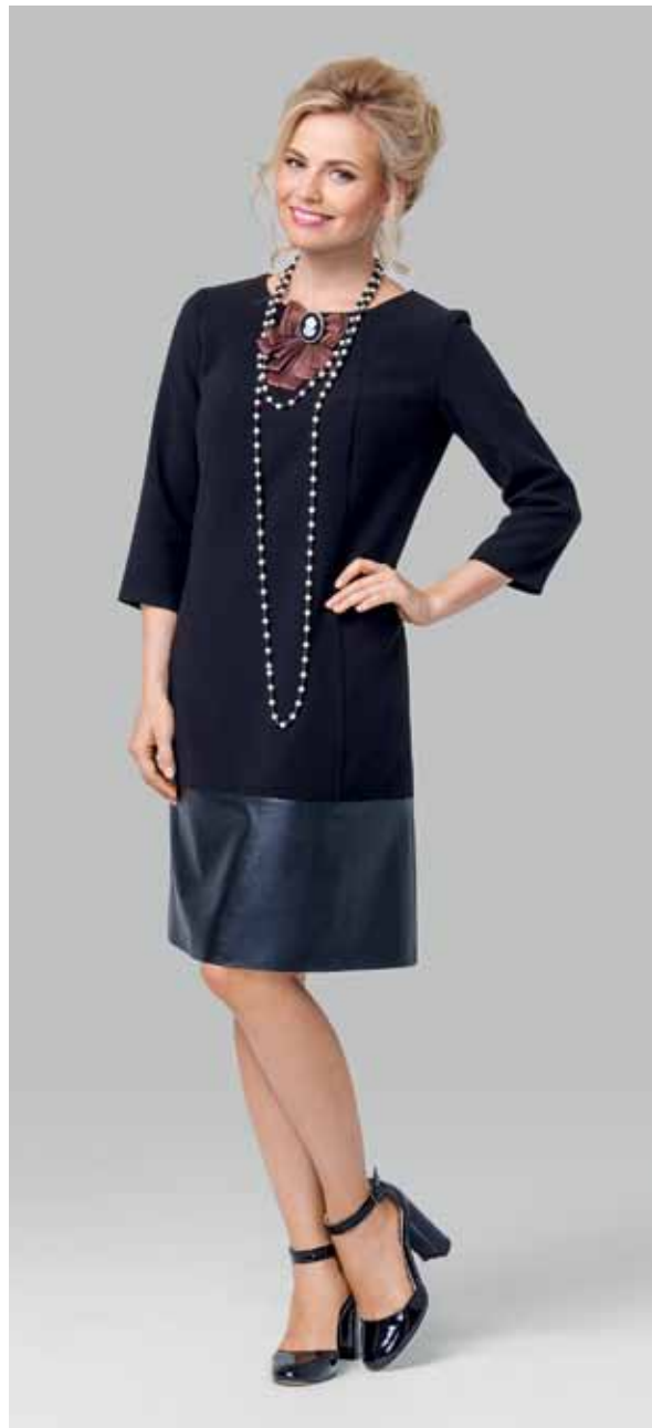
ПЛАТЬЕ арт. LA-716031