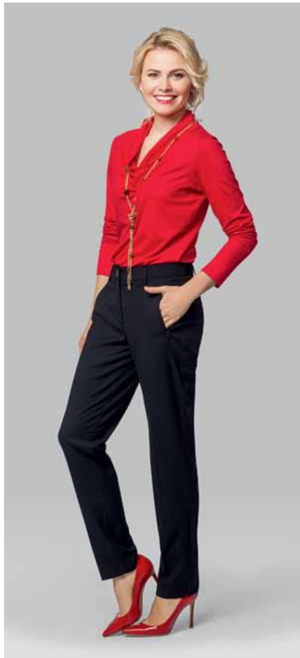
ДЖЕМПЕР арт. LA-713094 РАЗМЕР: 42-56 МАТЕРИАЛ: 95% вискоза | 5% эластан ЦВЕТ: принт "Геометрия" - красный | принт "Геометрия" - синий