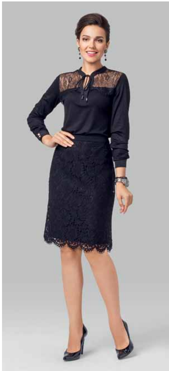
ЮБКА арт. LA-718092