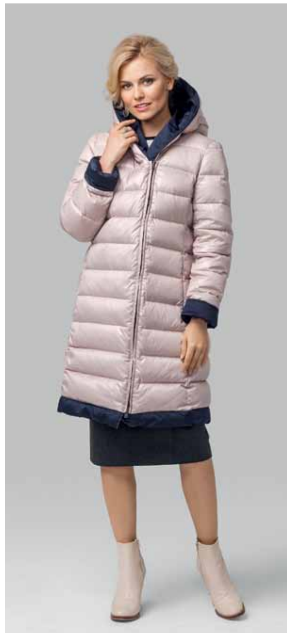
ПАЛЬТО ДВУХСТОРОННЕЕ арт. LA-D01256

РАЗМЕР: 44-60 | ДЛИНА: 92 см МАТЕРИАЛ: 87% полиэстер | 13% нейлон УТЕПЛИТЕЛЬ: натуральный пух