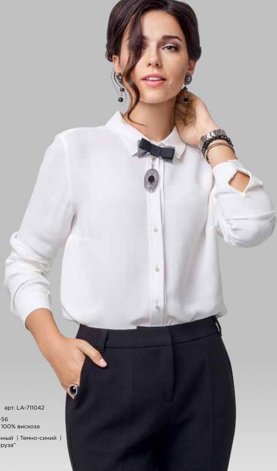
БЛУЗКА арт. LA-711042