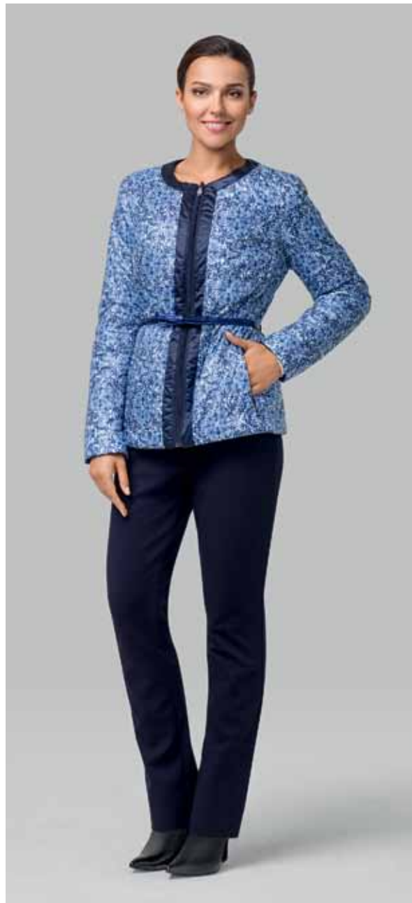
КУРТКА ДВУХСТОРОННЯЯ арт. LS-P03208

РАЗМЕР: 42-56 | ДЛИНА: 63 см МАТЕРИАЛ: 60%полиэстер | 40%нейлон УТЕПЛИТЕЛЬ: синтепон