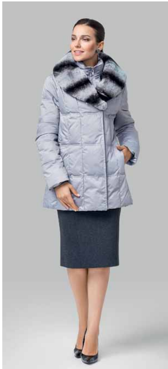
КУРТКА арт. LA-P03126

РАЗМЕР: 42-58 | ДЛИНА: 74 см МАТЕРИАЛ: 100% полиэстер УТЕПЛИТЕЛЬ: искусственный пух НАТУРАЛЬНЫЙ МЕХ: кролик ЦВЕТ: Графитовый | Светло-серый