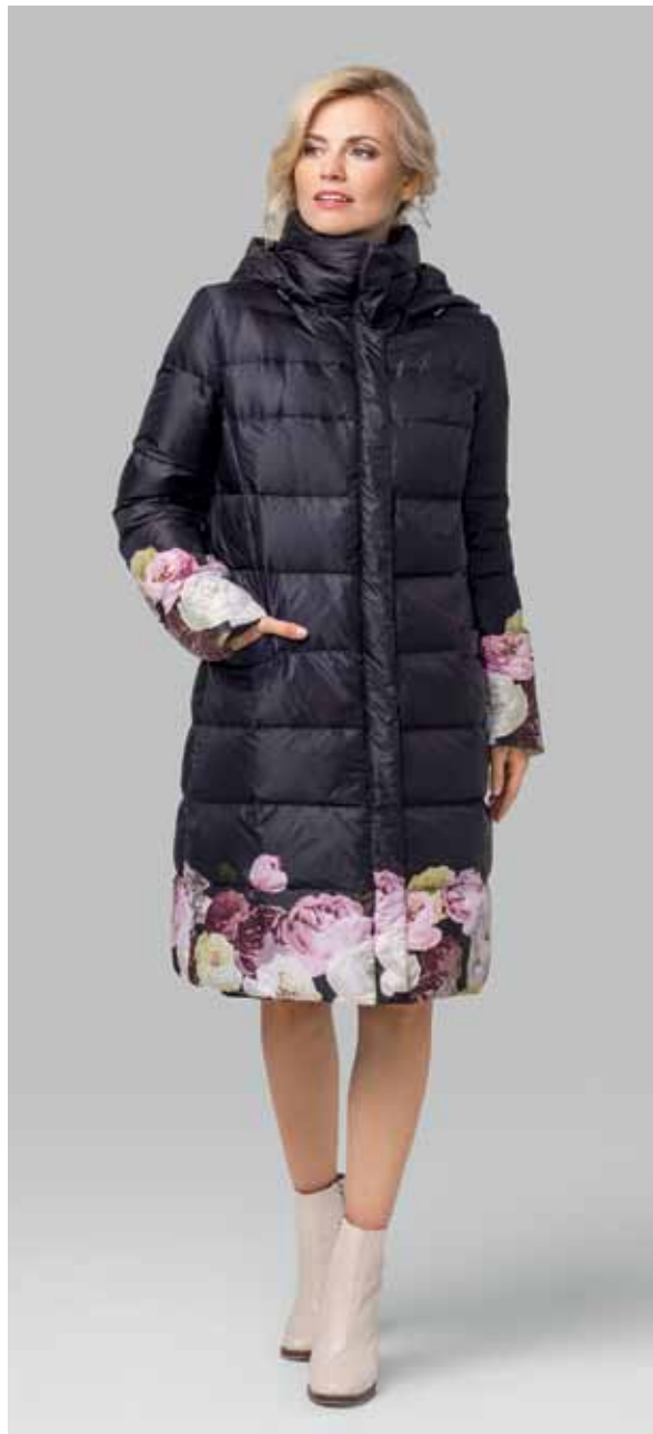
ПАЛЬТО арт. LA-D01122

РАЗМЕР: 42-58 | ДЛИНА: 74 см МАТЕРИАЛ: 100% полиэстер УТЕПЛИТЕЛЬ: искусственный пух НАТУРАЛЬНЫЙ МЕХ: кролик ЦВЕТ: Графитовый | Светло-серый