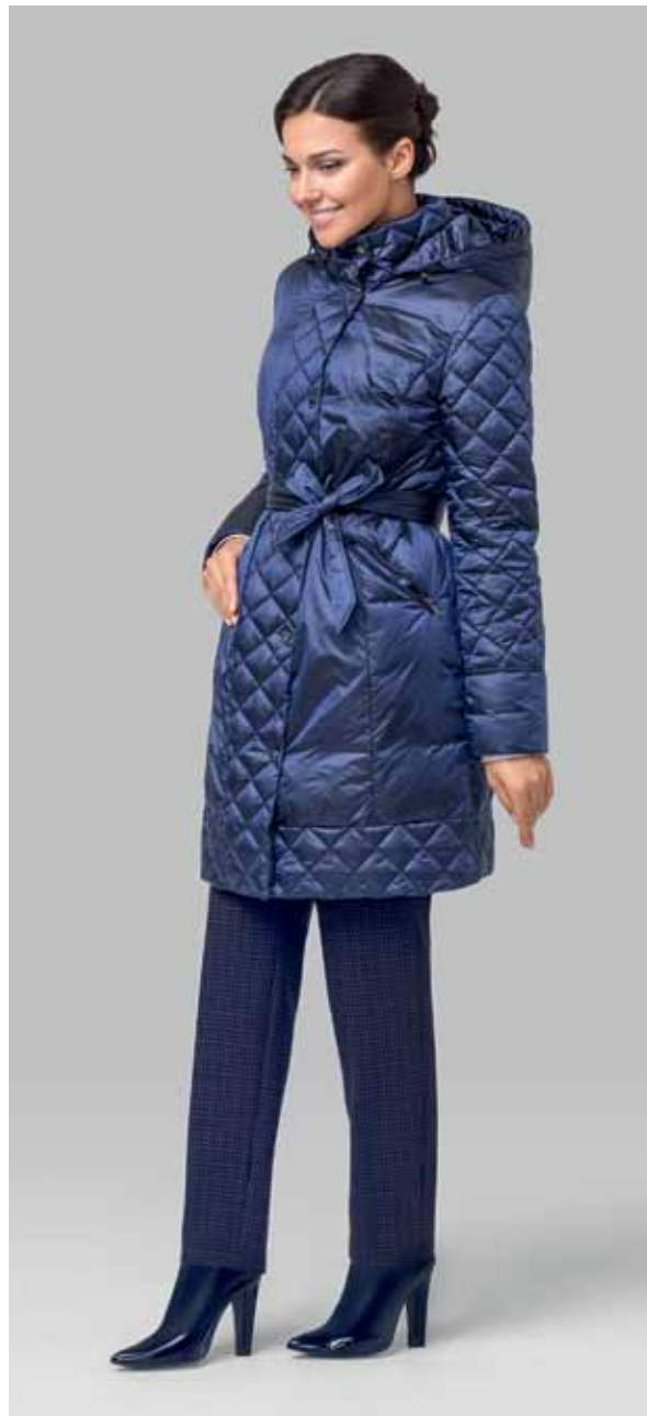
ПАЛЬТО арт. LA-F01255

РАЗМЕР: 42-58 | ДЛИНА: 91 см МАТЕРИАЛ: 100% нейлон УТЕПЛИТЕЛЬ: искусственный пух