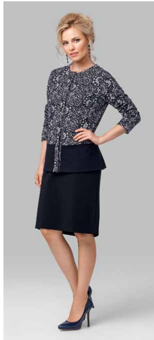
ЮБКА арт. LA-718061

РАЗМЕР: 42-56 МАТЕРИАЛ: 60% вискоза | 30% полиамид | 10% лайкра ЦВЕТ: Черный | Синий