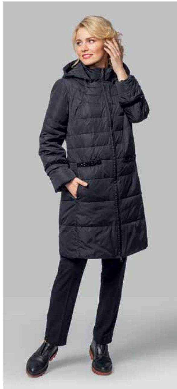
ПАЛЬТО арт. LA-P01121

РАЗМЕР: 42-56 | ДЛИНА: 94 см МАТЕРИАЛ: 100% нейлон УТЕПЛИТЕЛЬ: синтепон