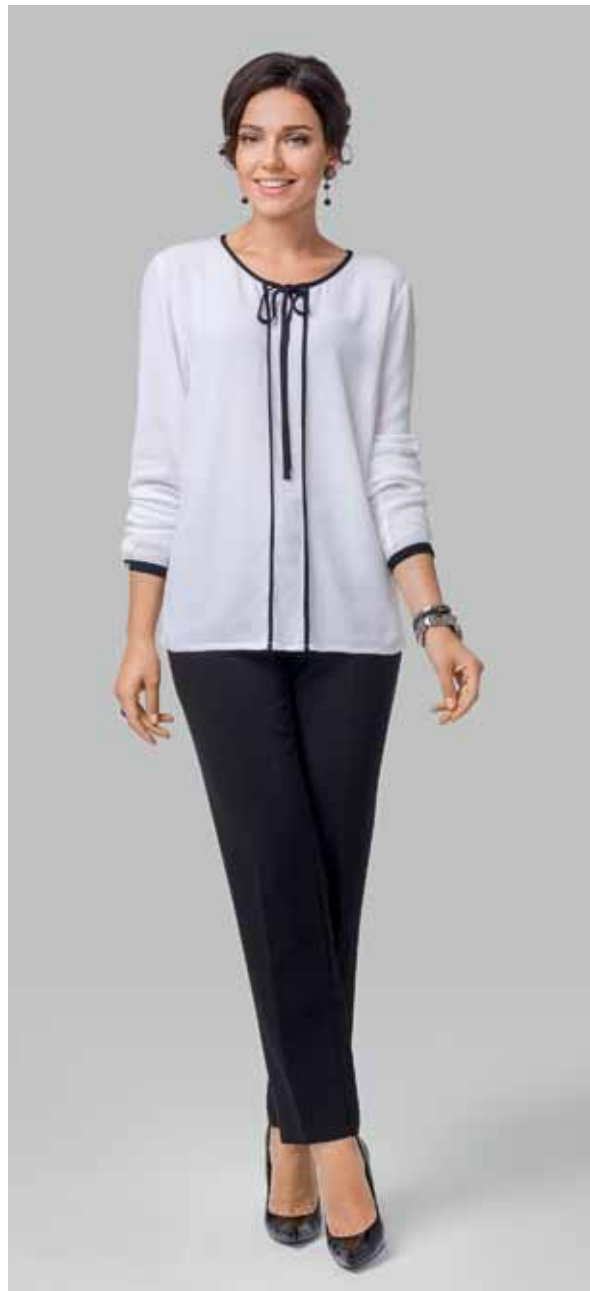
БЛУЗКА арт. LA-711008