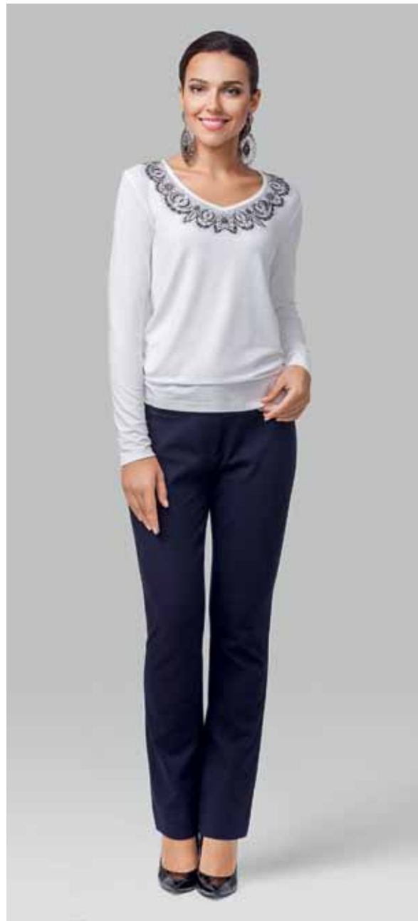
БРЮКИ арт. LA-719118

РАЗМЕР: 42-56 МАТЕРИАЛ: 95% вискоза | 5% эластан ЦВЕТ: Молочный | Черный