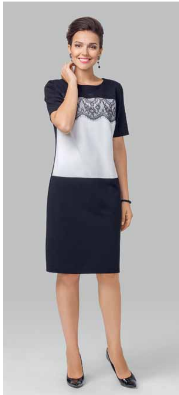
ПЛАТЬЕ арт. LA-716109