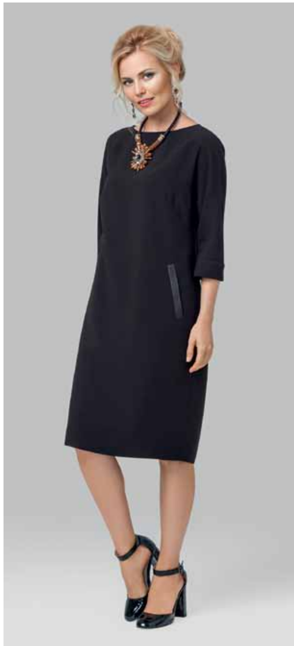
ПЛАТЬЕ арт. LA-716122