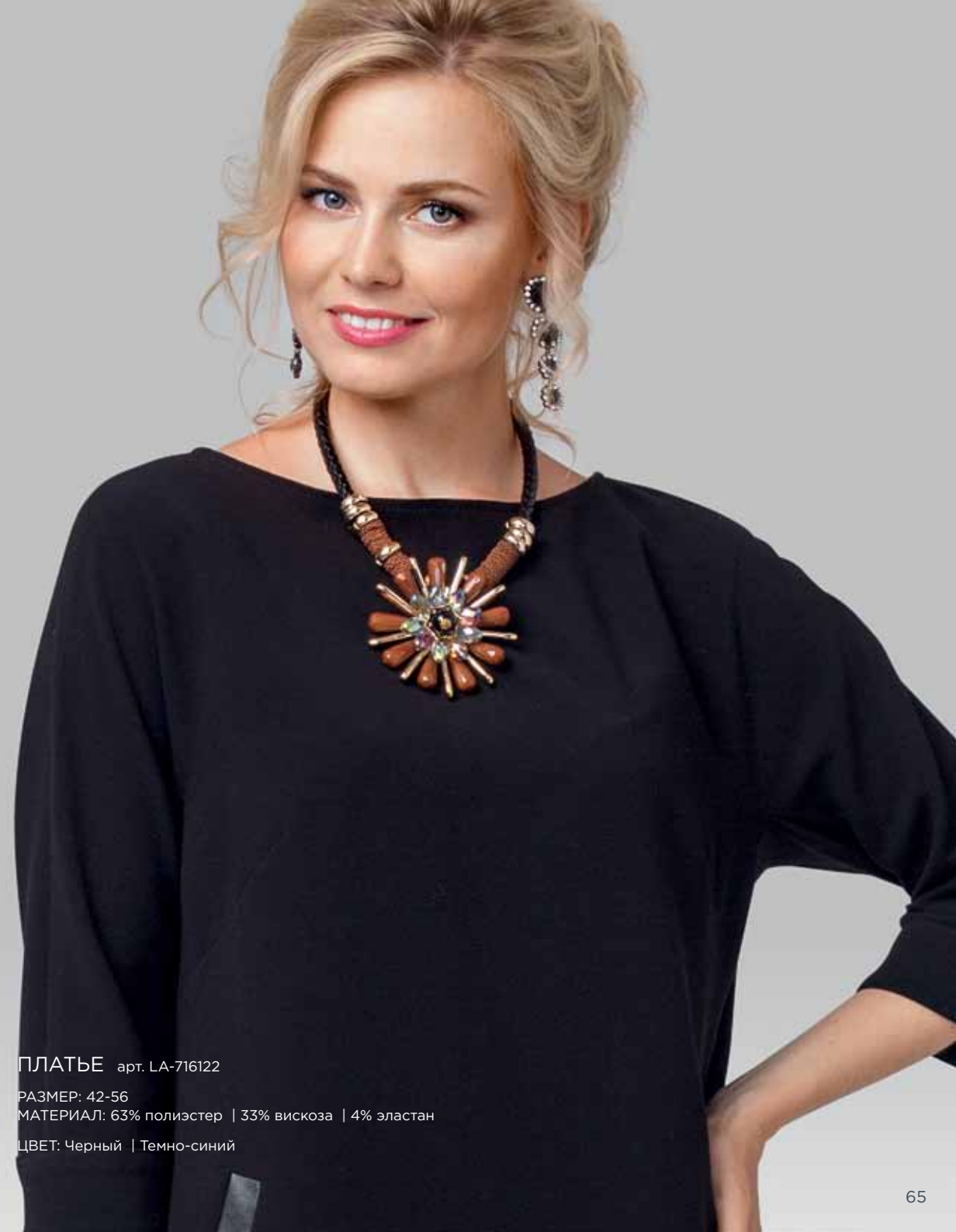
ПЛАТЬЕ арт. LA-716122