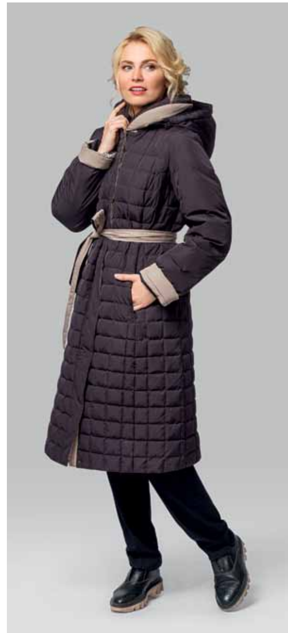
ПАЛЬТО арт. LA-D01276