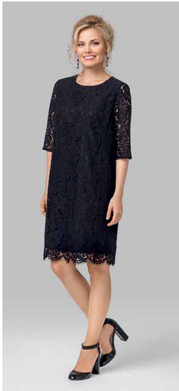
ПЛАТЬЕ арт. LA-716004