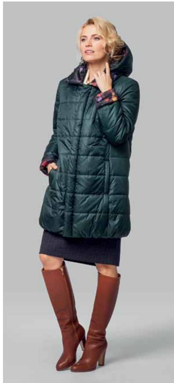
КУРТКА ДВУХСТОРОННЯЯ арт. LA-D03180

РАЗМЕР: 42-58 | ДЛИНА: 82 см МАТЕРИАЛ: 100% полиэстер УТЕПЛИТЕЛЬ: натуральный пух