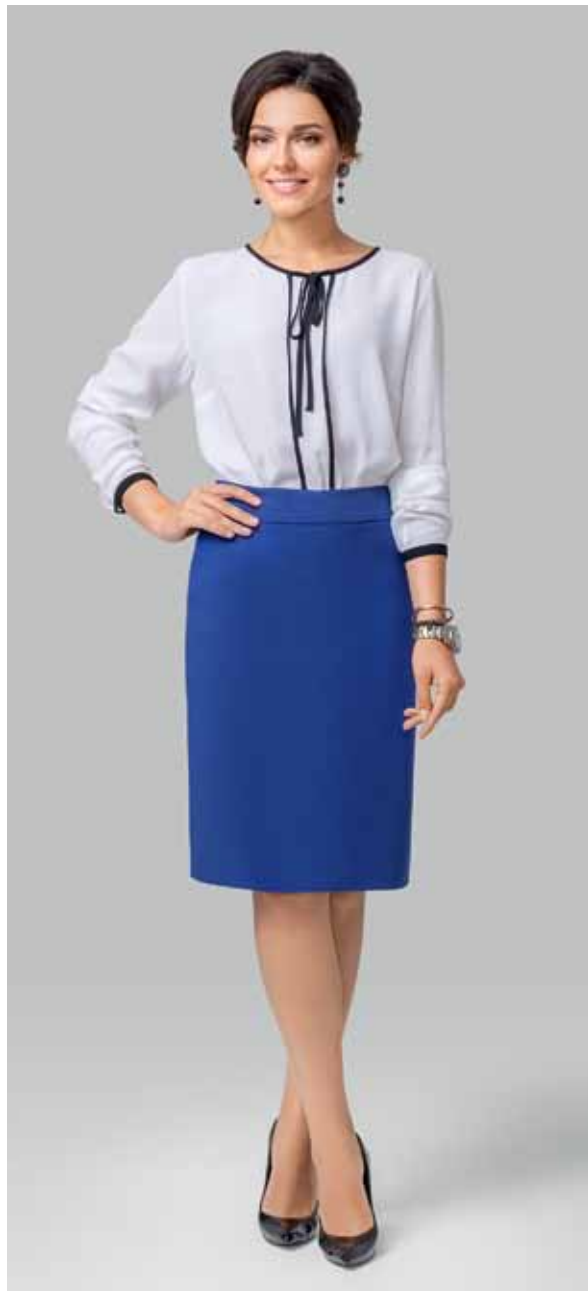
ЮБКА арт. LA-718062