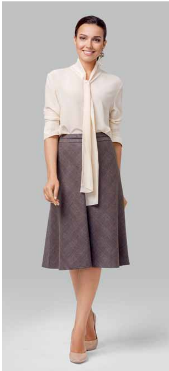
ЮБКА арт. LA-18520

РАЗМЕР: 44-56 МАТЕРИАЛ: 63% полиэстер | 34% вискоза | 3% эластан