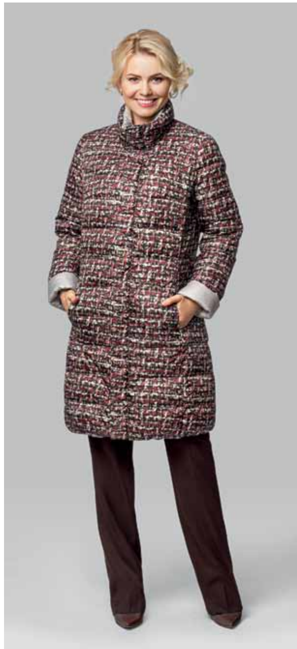
ПАЛЬТО ДВУХСТОРОННЕЕ арт. LA-D01183

РАЗМЕР: 42-56 | ДЛИНА: 93 см МАТЕРИАЛ: 100% полиэстер УТЕПЛИТЕЛЬ: натуральный пух НАТУРАЛЬНЫЙ МЕХ: енот