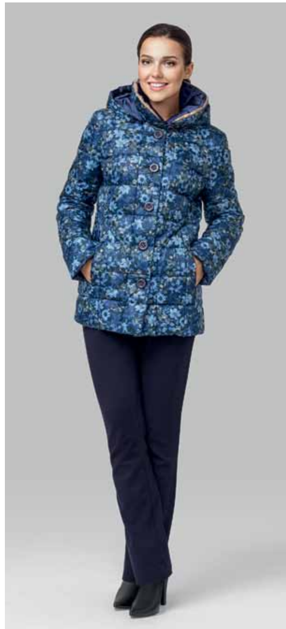
КУРТКА ДВУХСТОРОННЯЯ арт. LA-F03282

ЦВЕТ: Темно-синий | Кофейный | Красный | Синий