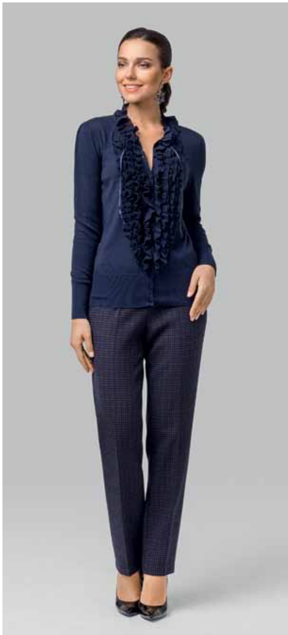
КАРДИГАН арт. LA-723116