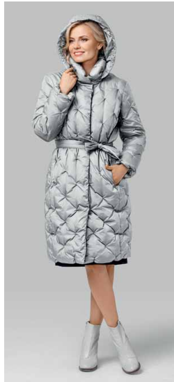
ПАЛЬТО арт. LA-D01251

РАЗМЕР: 44-60 | ДЛИНА: 102 см МАТЕРИАЛ: 58% полиэстер | 42%нейлон УТЕПЛИТЕЛЬ: синтепон ЦВЕТ: Серый | Светло-серый | Темно-синий | Жемчужно-серый | Темно-зеленый | Черный