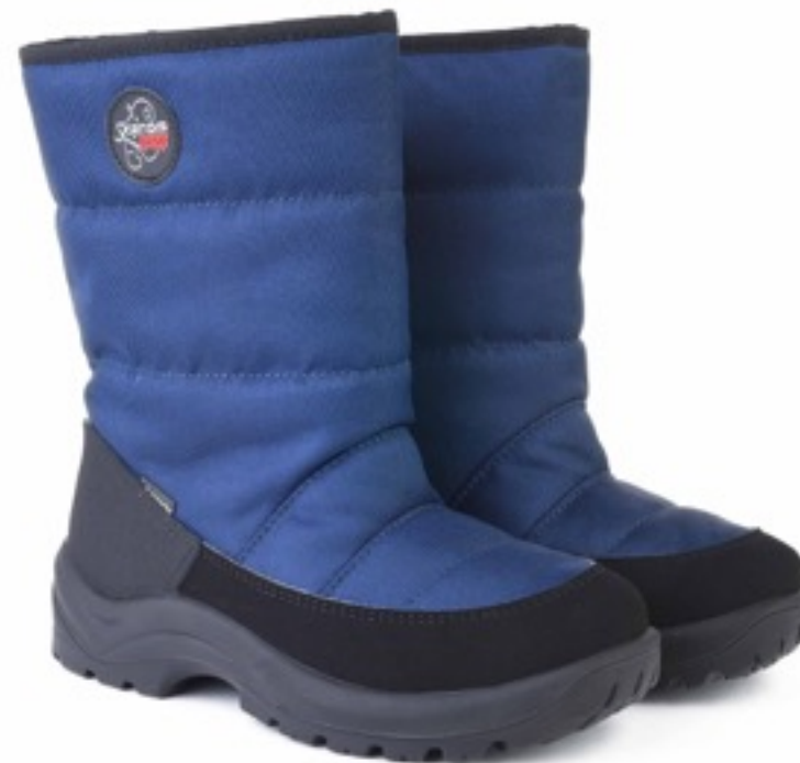
Синий Техник / TuonoAlbanyTecnic_ Navy