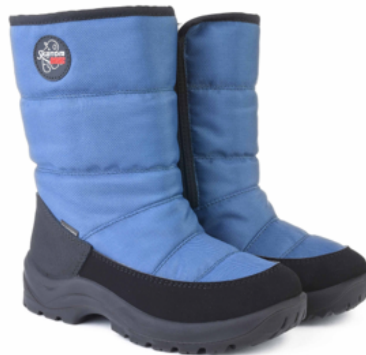
Св.синий Техник / TuonoAlbanyTecnic_ Sugar