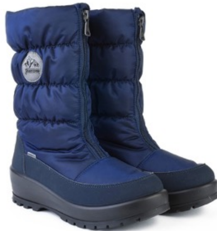
Синий Динамик / TuonoDinamic_Navy