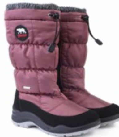
Альтроза Динамик / Tuono Dinamic_BlkJRose