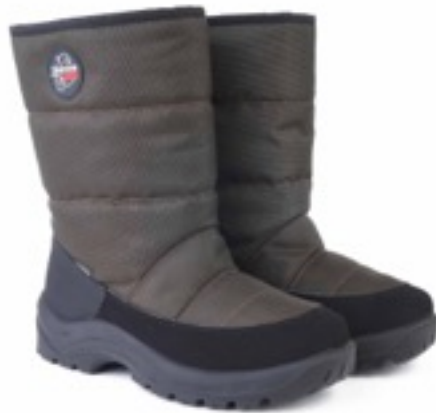
Милитар Техник / TuonoAlbany Tecnic_ Militar