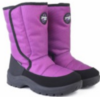
Фиолетовый Техник / TuonoAlbany Tecnic_ Purple