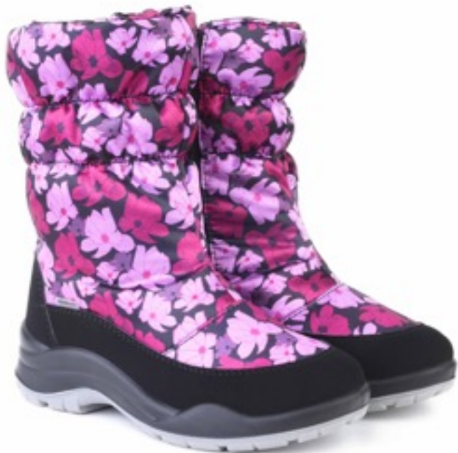
Розовый Мальва / TuonoMalvaFlower_Cyclamen