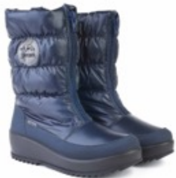
Синий Балтико / Tuono Baltico_Navy