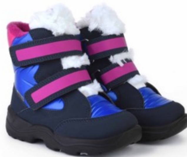
Электрик Балтико / Tuono Baltico_BlueCyclamen