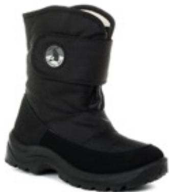
Черный Техник / Tuono Albany Tecnic Black