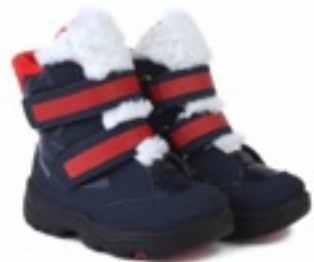
Синий Балтико / Tuono Baltico_NavyRed