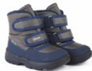
Коричневый Динамик / Tuono Dinamic_MudNavy