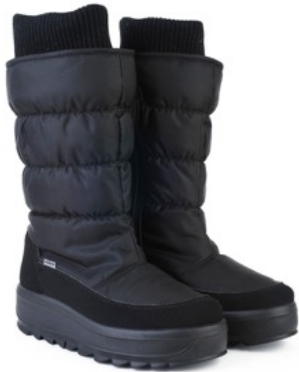
Черный Динамик / TuonoDinamic_Blк