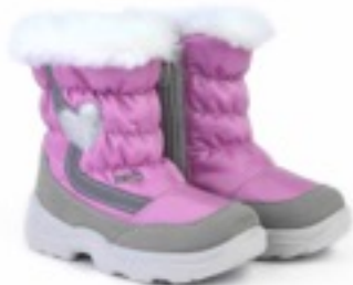
Розовый Динамик / Tuono Dinamic_GreyGum