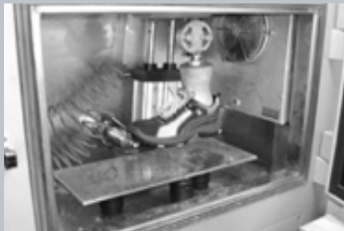
Testing Section (Italy)

Материалы, используемые компанией Skandia в изготовлении подошв, соответствуют условиям окружающей среды и результатам исследований типов местности. Результатом каждого проекта является комбинация дизайна, методов производства и исследований по поиску лучших материалов для компонентов подошвы. Повышенная износостойкость подошвы наряду с отличными противоскользящими свойствами обеспечивают непревзойденный комфорт, а также отличную устойчивость и безопасность в любых погодных условиях. Воздушные полости в молекулярной структуре материала подошвы создают воздушную подушку между ступней и поверхностью, что улучшает термоизоляцию и повышает амортизирующий эффект для пятки.