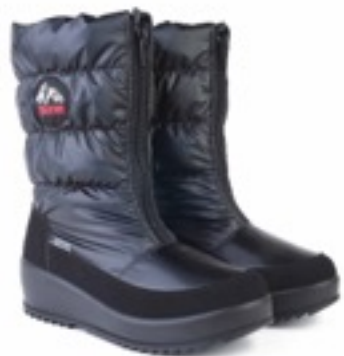
Черный Джойфул / TuonoJoyfull_Blк