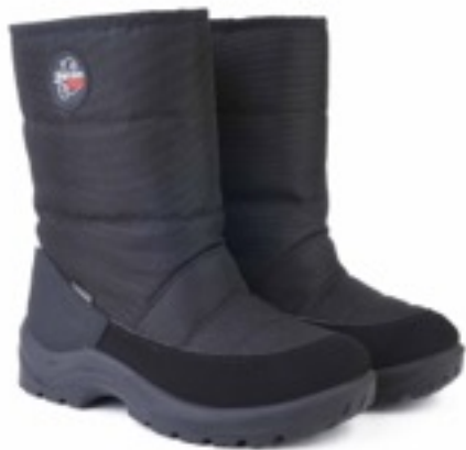
Черный Техник / TuonoAlbany Tecnic_ Black