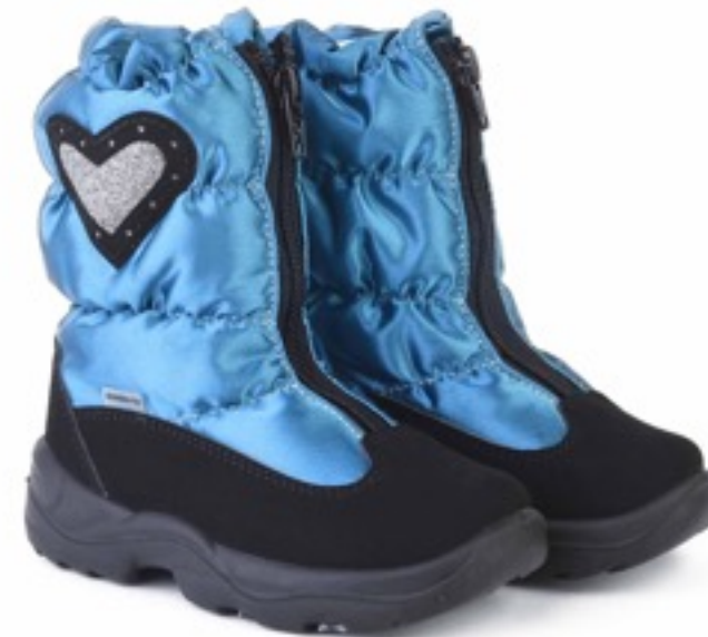
Изумрудный Тирана / Tuono Tirana_BlkJSmerald