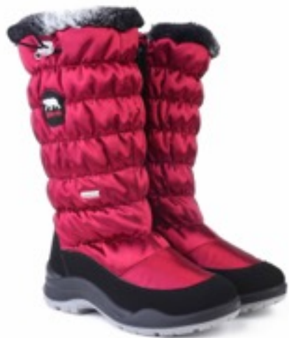
Бордовый Тирана / TuonoTirana_BlкBordeaux