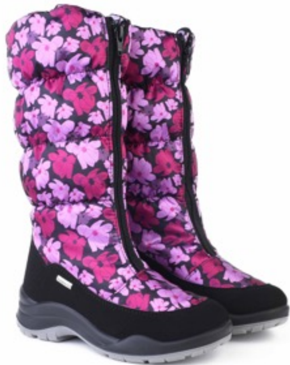
Розовый Мальва / TuonoMalvaFlower_Cyclamen