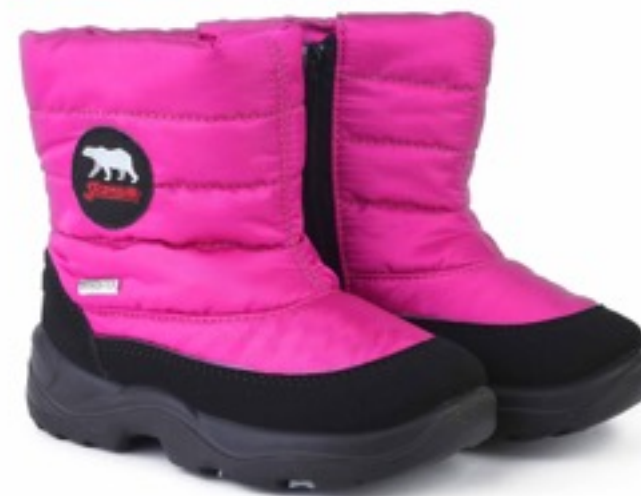
Фуксия Динамик / Tuono Dinamic_BlkJFuxia