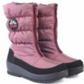
Альтроза Динамик / Tuono Dinamic_BlкRose