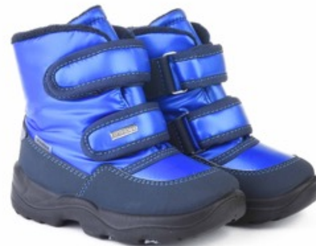
Электрик Балтико / Tuono Baltico_BlueNavy