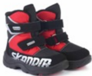
Черно-красный Техник / Tuono Tecnic_BlKRed