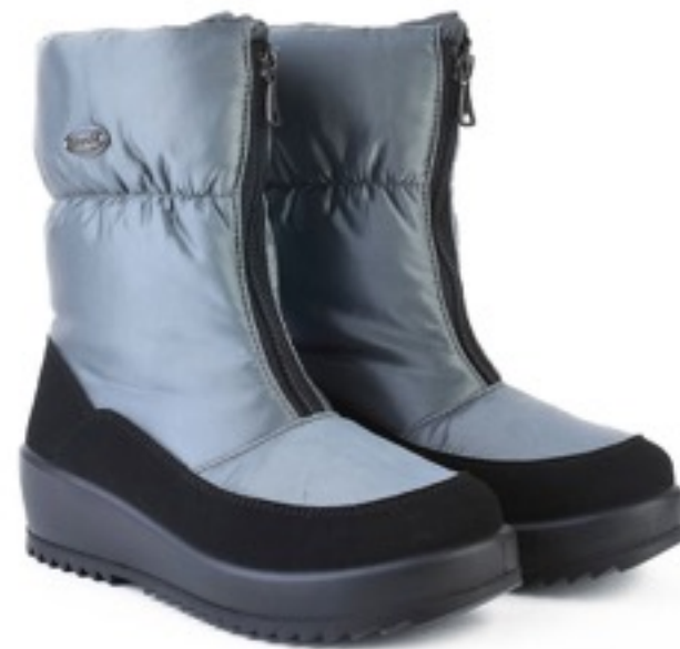
Серый Динамик / TuonoDinamic_BlкRoute