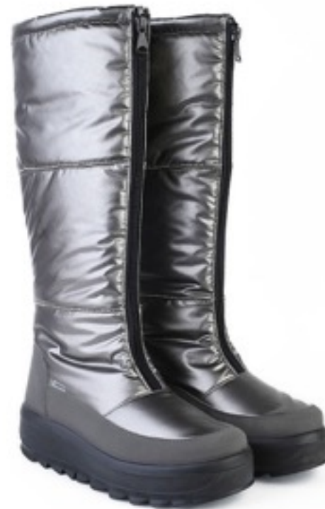
Пельтро Балтико / TuonoBalticoLapin_Pewter