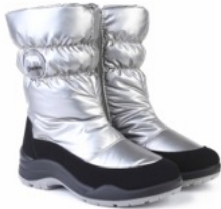
Серебряный Балтико / Tuono Baltico_BlкSilver