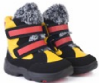
Желтый Джойфул / Tuono Joyfull_YellowRed