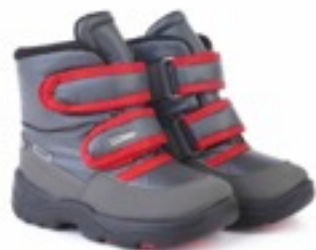
Серый Джойфул / Tuono Joyfull_GraphiteRed