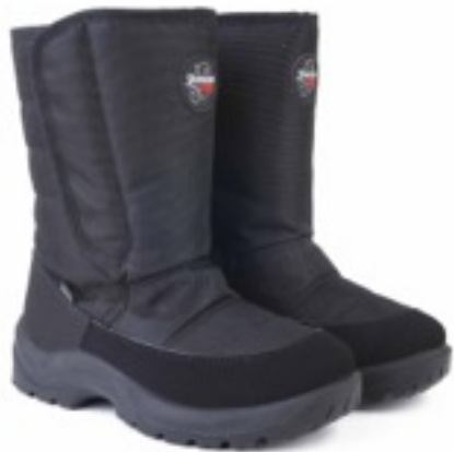
Черный Техник / TuonoAlbany Tecnic_ Black