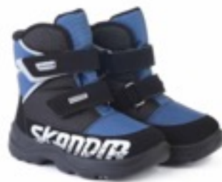
Сине-черный Техник / Tuono Tecnic_NavyBlk