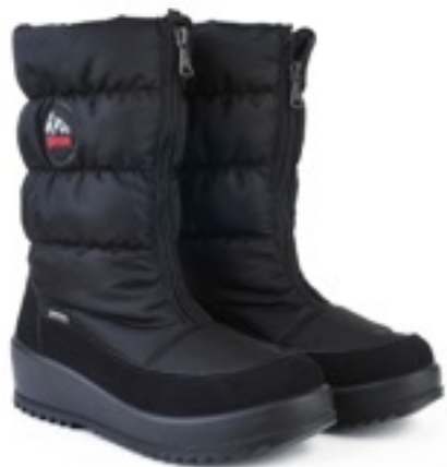
Черный Динамик / TuonoDinamic_Blк