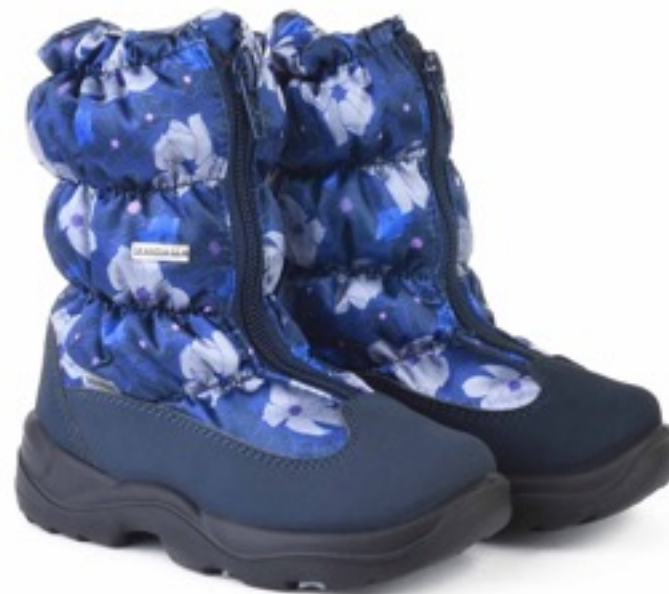
Синий Мальва / TuonoMalvaFlower_Navy