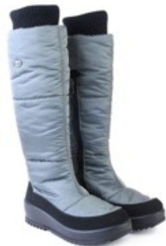
Серый Динамик / TuonoDinamic_BlRoute