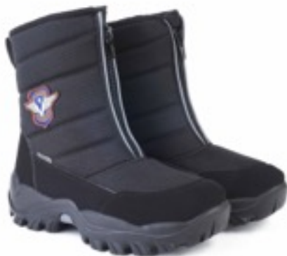
Черный Техник / Tuono Tecnic_ BlkYellow