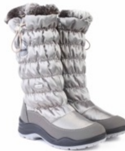
Бежевый Тирана / Tuono Tirana_Taupe