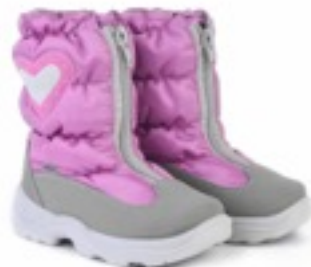
Розовый Динамик / Tuono Dinamic_GreyGum