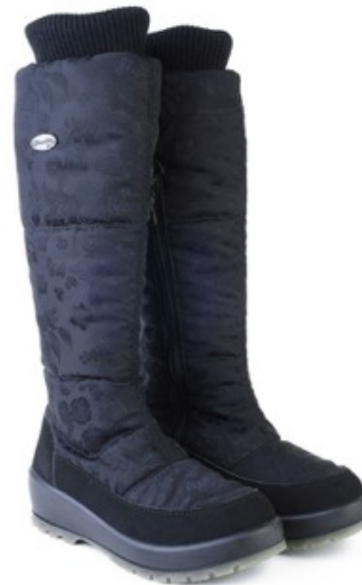
Черный Цветы / TuonoFlowers_Bl