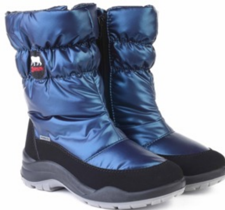
Петрол Балтико / Tuono Baltico_BlкPetrol