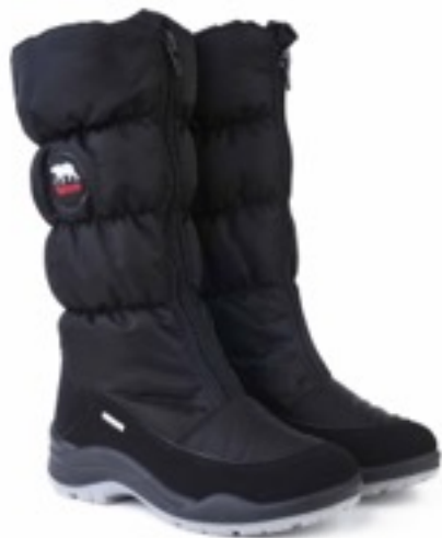
Черный Динамик / Tuono Dinamic_Blк