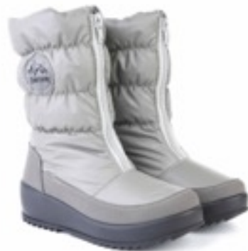
Бежевый Джойфул / TuonoJoyfull_Desert