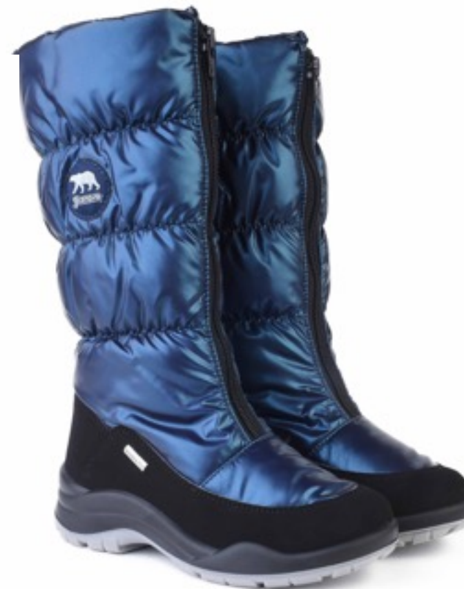
Петрол Балтико / Tuono Baltico_BlкPetrol