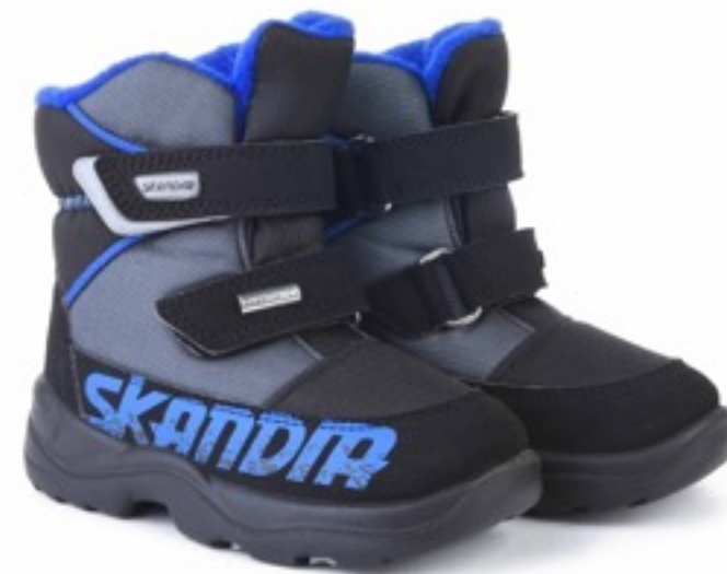
Черно-серый Техник / Tuono Tecnic Black/Graphite