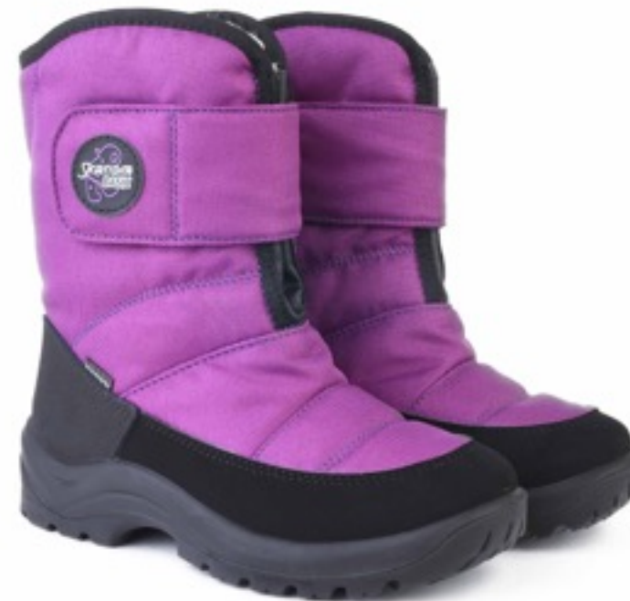
Фиолетовый Техник / Tuono Albany Tecnic_ Purple