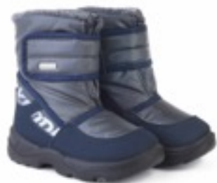
Серый Джойфул / TuonoTecnicoJoyfull_Graphite