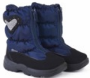
Синий Динамик / Tuono Dinamic_Navy