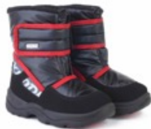
Черный Джойфул / TuonoTecnicoJoyfull_BlkJRed