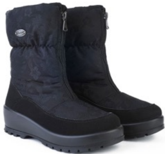
Черный Цветы / TuonoFlowers_Blк