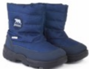
Синий Техник / Tuono Tecnic_Navy