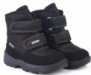
Черный Динамик / Tuono Dinamic_BlK Militar