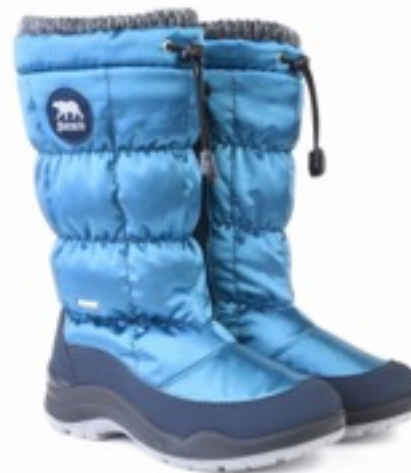
Изумрудный Тирана / TuonoTirana_NavySmerald