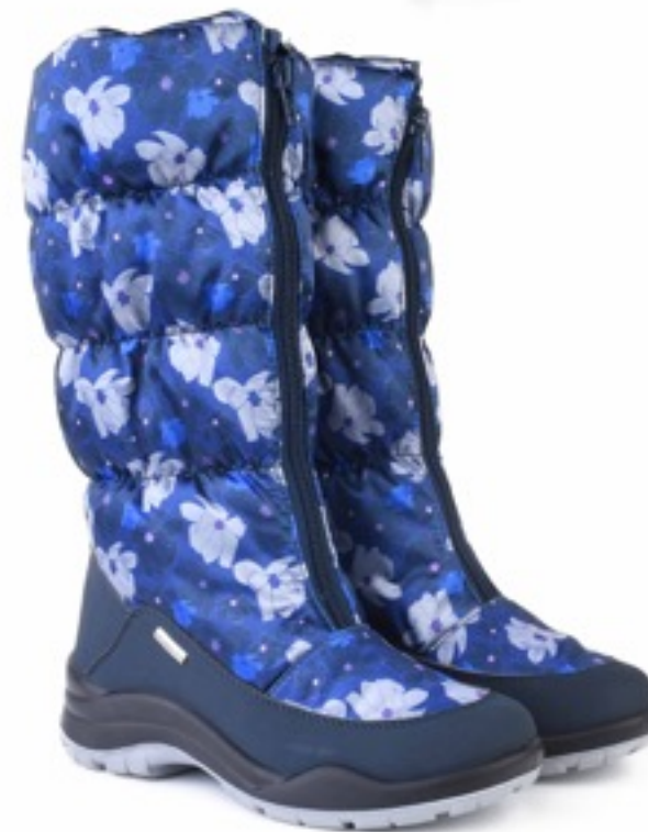
Синий Мальва / TuonoMalvaFlower_Navy