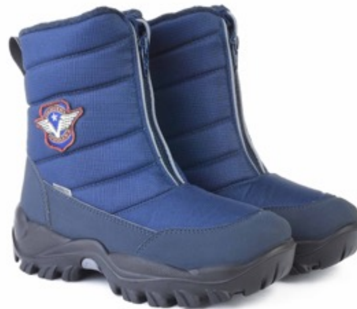
Синий Техник / Tuono Tecnic_ NavyBlue