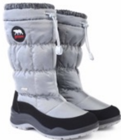
Серый Динамик / TuonoDinamic_BlkJAshGrey