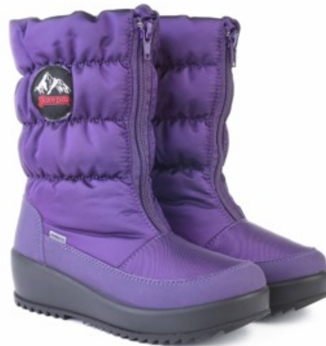
Фиолетовый Динамик / Tuono Dinamic_Purple