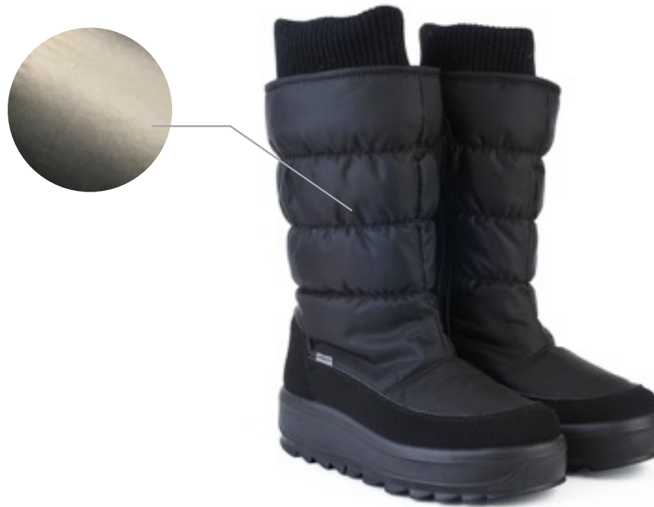
Савана Динамик / TuonoDinamic_Blк