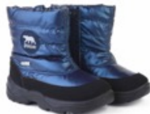
Петрол Балтико / Tuono Baltico_BlkJPetrol