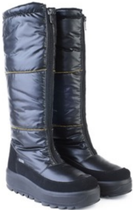
Черный Балтико / TuonoBalticoLapin_Blк