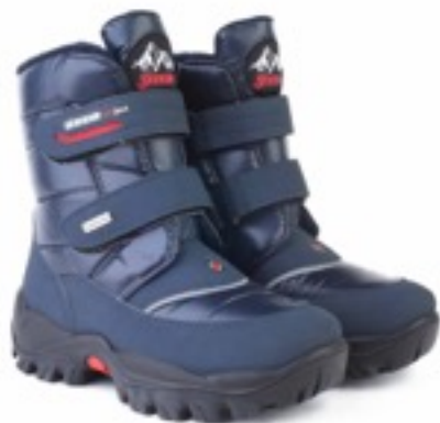
Синий Балтико / Tuono Baltico_Navy