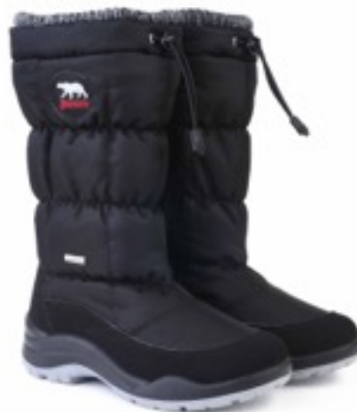
Черный Динамик / Tuono Dinamic_BlkJ