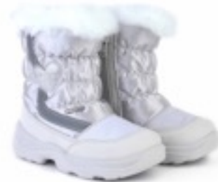
Серебряный Тирана / Microfibra Tirana_IceSilver