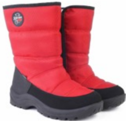
Красный Техник / TuonoAlbany Tecnic_ Red