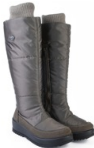
Савана Динамик / TuonoDinamic_Taupe