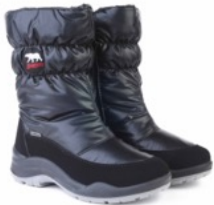
Черный Балтико / Tuono Baltico_Blк