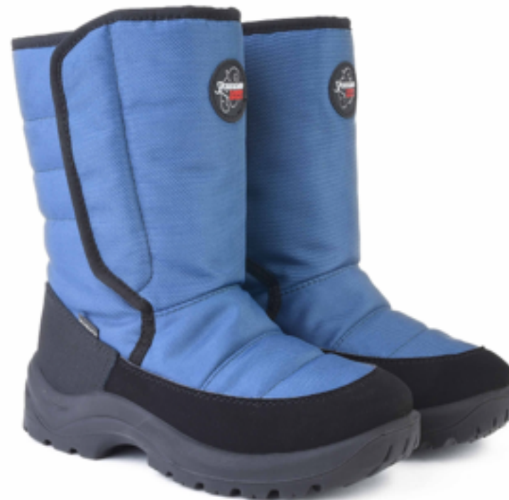
Св.синий Техник / TuonoAlbanyTecnic_ Sugar