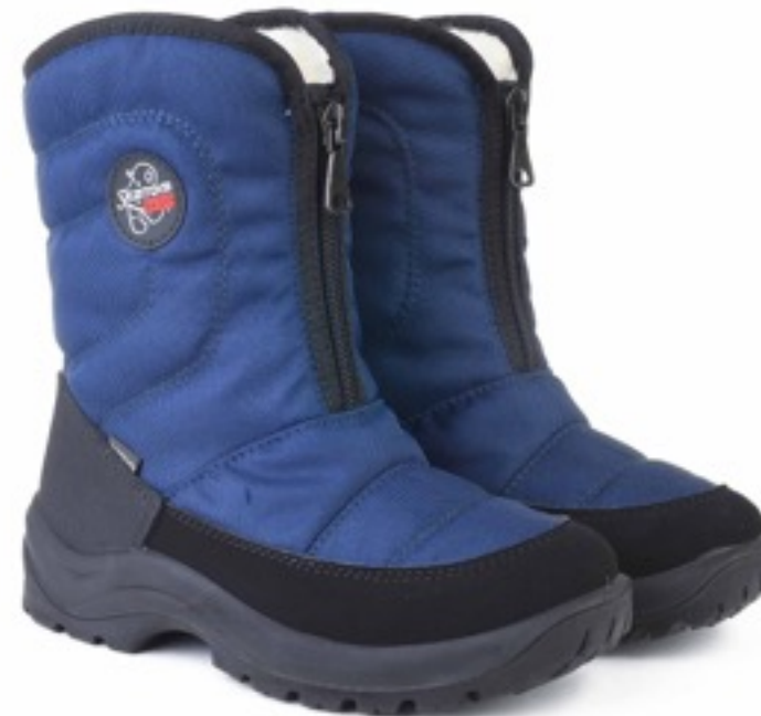
Синий Техник / TuonoAlbanyTecnic_ Navy