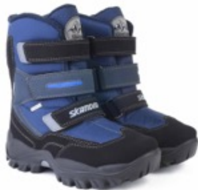
Синий Техник / Tuono Tecnic_ NavyBlue