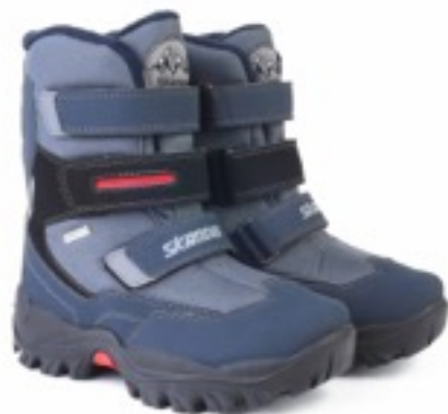
Серый Техник / Tuono TecnicBaltic_ NavyGraphite