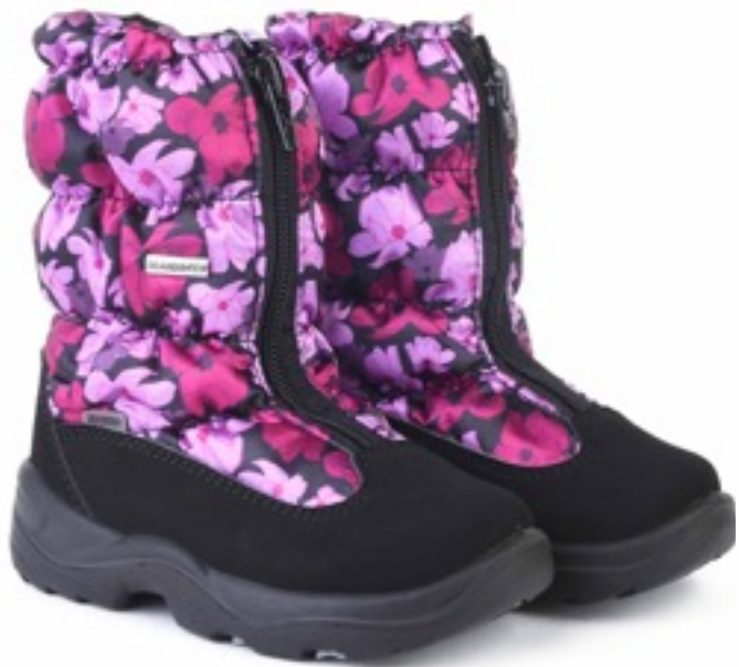
Розовый Мальва / TuonoMalvaFlower_Cyclamen