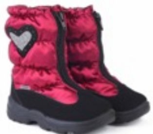
Бордовый Тирана / Tuono Tirana_BlkJBordeaux