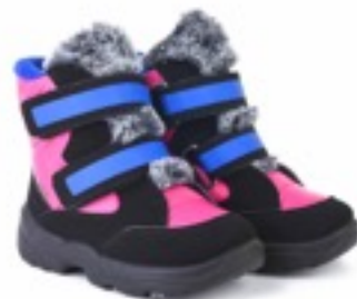
Цикламен Балтико / Tuono Baltico_Cyclamen