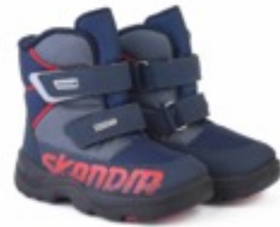
Сине-серый Техник / Tuono Baltico_BlKCyclusmen