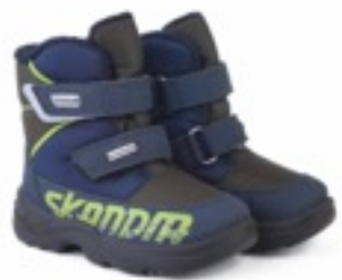
Милитар-синий Техник / Tuono Tecnic_MilitarNavy