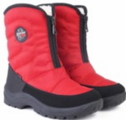
Красный Техник / TuonoAlbany Tecnic_ Red