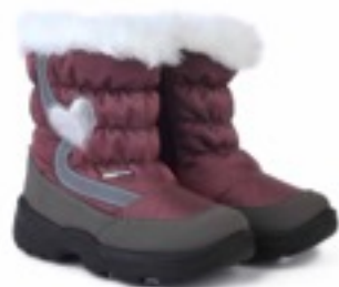
Альтроза Динамик / Tuono Dinamic_TaupeRose