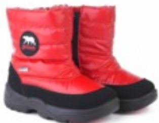
Красный Балтико / Tuono Baltico_BlkJRed