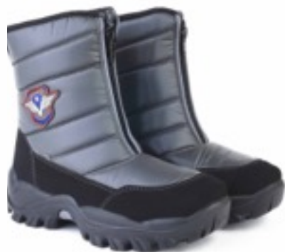
Серый Джойфул / Tuono Joyfull_BlkJGraphite