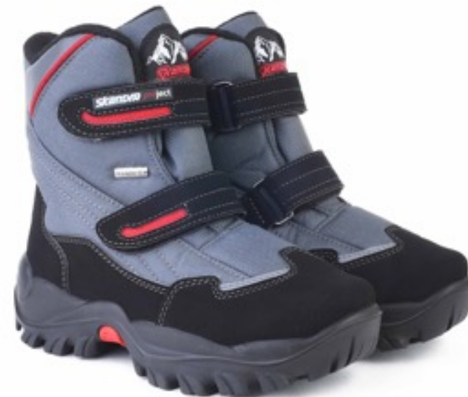
Серый Техник / Tuono JoyfullTecnic_Graphite