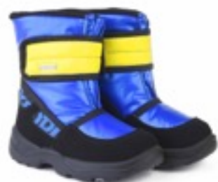
Электрик Балтико / TuonoTecnicoBaltico_BlkJBlue