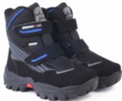
Черный Техник / Tuono Baltico Tecnic_ Blk