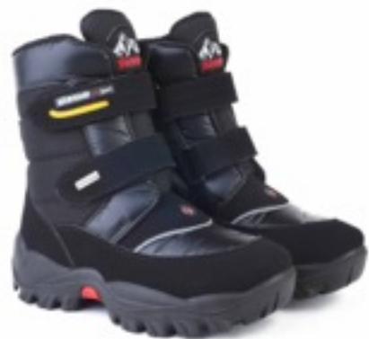
Черный Балтико / Tuono BalticoTecnic_Blк