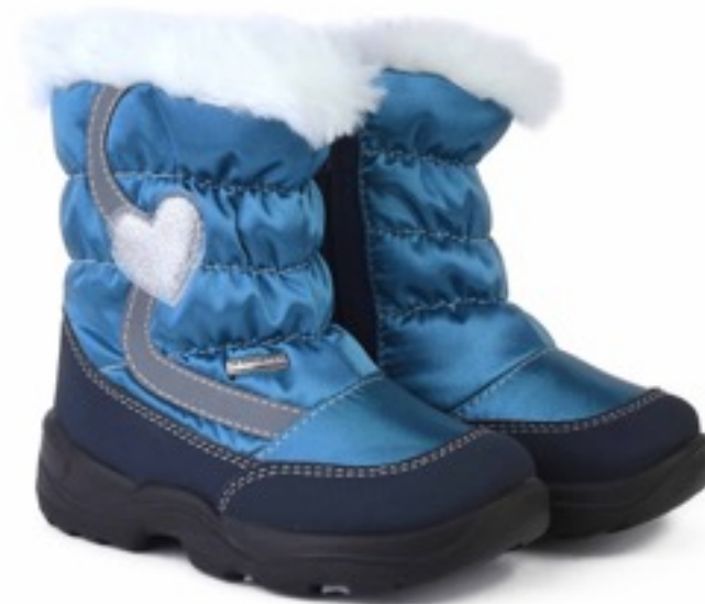
Изумрудный Тирана / Tuono Tirana_NavySmerald