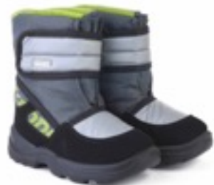
Серый Техник / TuonoTecnicoJoyfull_GreyBlk