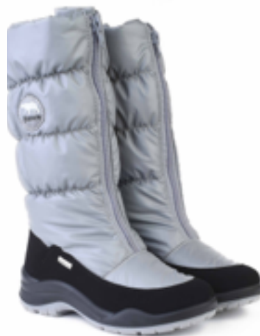
Св.серый Джойфул / Tuono Joyfull_BlкGrey