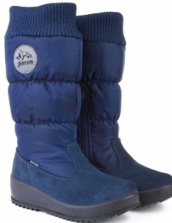
Синий Динамик / SuedeDinamic_Navy