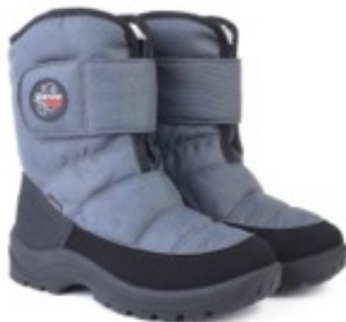
Серый Техник / Tuono Albany Tecnic_ Graphite