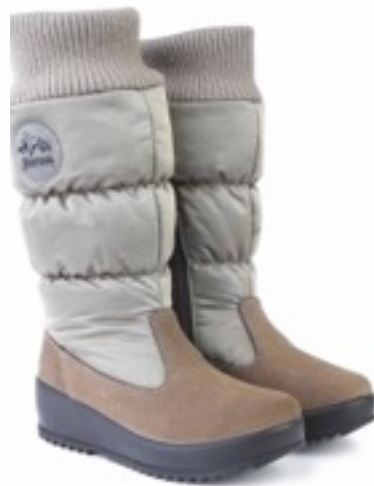
Савана Динамик / SuedeDinamic_Taupe