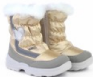
Золотой Тирана / Tuono Tirana_TaupeGold