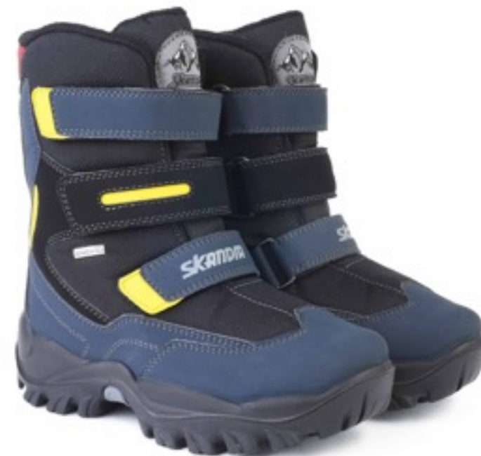
Черный Техник / Tuono Tecnic_ BlkYellow