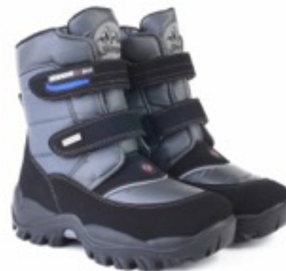
Серый Джойфул / Tuono JoyfullTecnic_Graphite