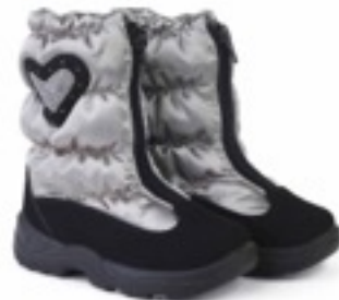
Бежевый Тирана / Tuono Tirana_BlkJTaupe