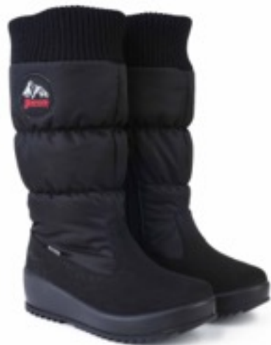
Черный Динамик / SuedeDinamic_Blк