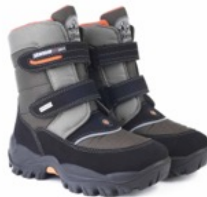
Милитар Техник / TuonoTecnic_MilitarGrey