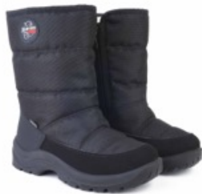
Черный Техник / TuonoAlbany Tecnic_ Black