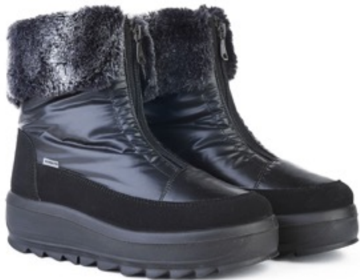
Черный Балтико / TuonoBalticoLapin_Blк