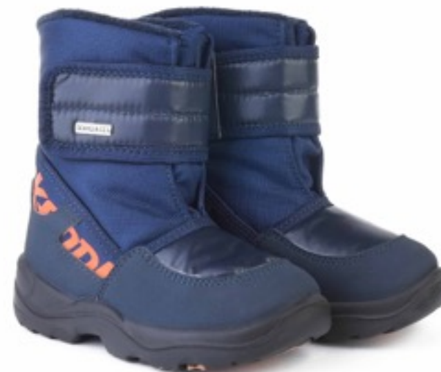
Синий Техник / TuonoTecnicoBaltico_Navy