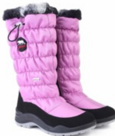
Розовый Динамик / Tuono Dinamic_BlкGum