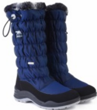
Синий Динамик / Tuono Dinamic_BlкNavy