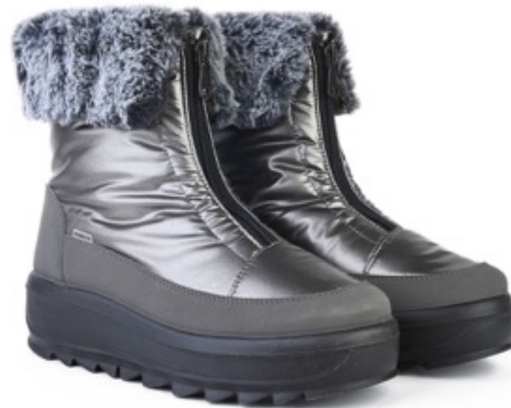
Пельтро Балтико / TuonoBalticoLapin_Pewter