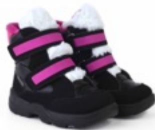
Черный Балтико / Tuono Baltico_BlkJCyclamen