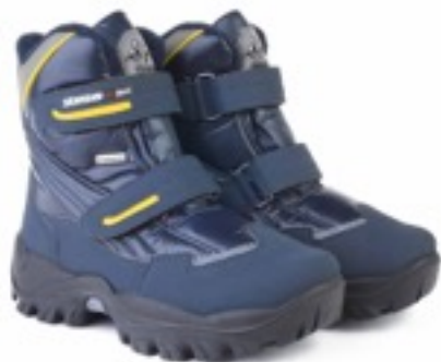
Синий Балтико / Tuono Baltico_Navy