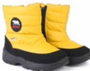
Желтый Джойфул / Tuono Joyfull_BlkJYellow