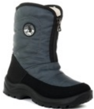
Серый Техник / Tuono Albany Tecnic Graphite