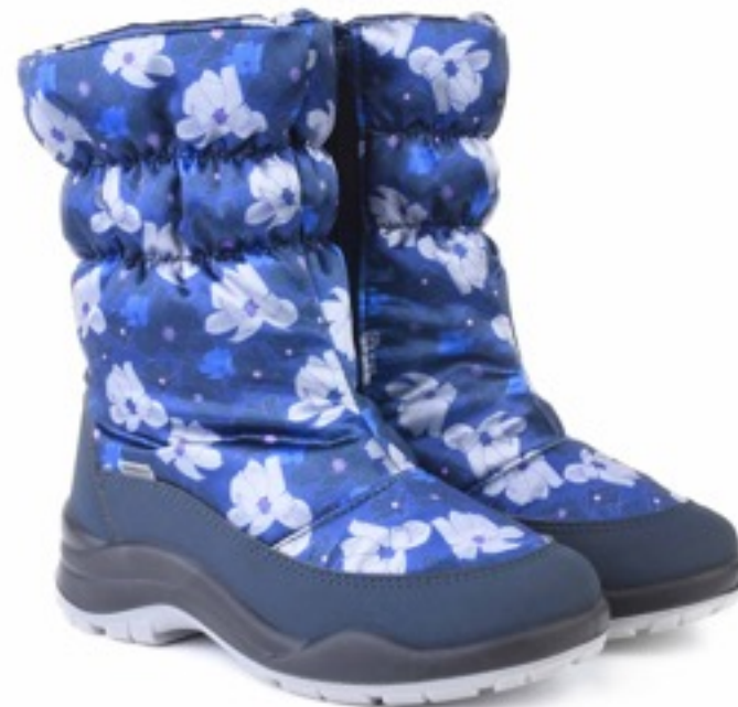
Синий Мальва / TuonoMalvaFlower_Navy