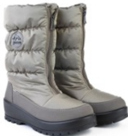
Савана Динамик / TuonoDinamic_Taupe