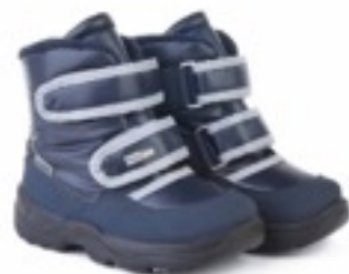
Синий Балтико / Tuono Baltico_NavyMetal